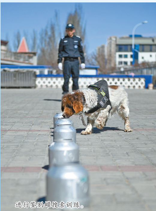
进行鉴别罐搜索训练。