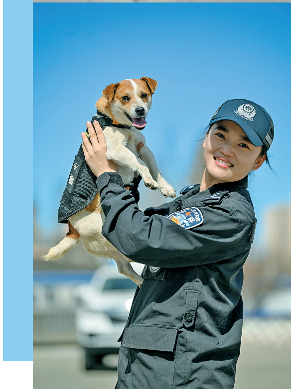
人犬相伴,共护平安。