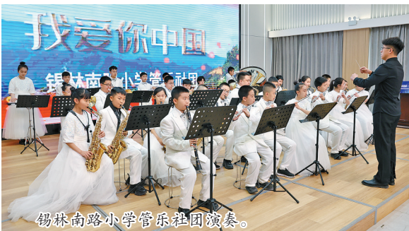
锡林南路小学音乐社团演奏。