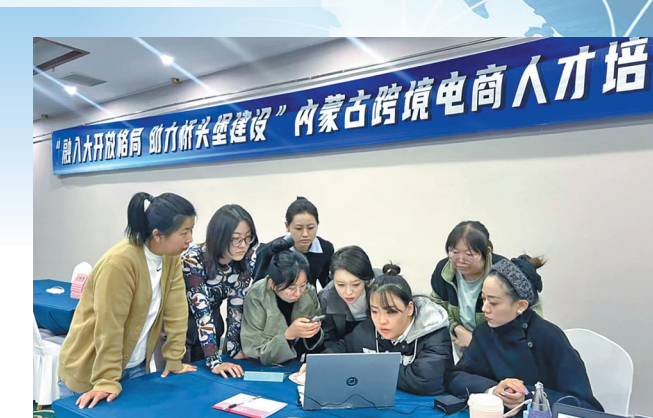
培训中,青年们认真讨论学习。