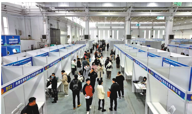
招聘会上的跨境电商外贸专区。