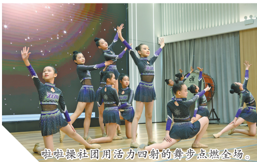
啦啦操社团用活力四射的舞步点燃全场。