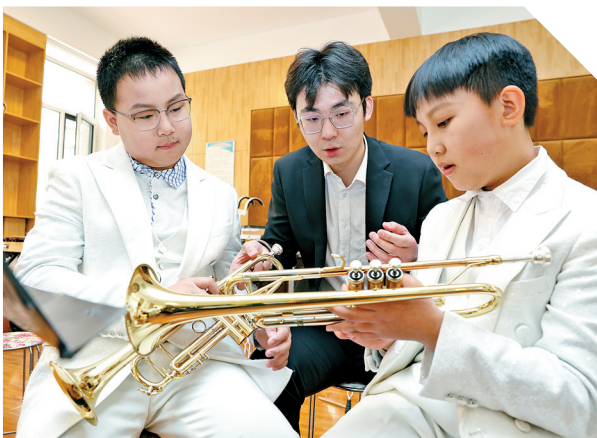
演奏家们对管乐社团成员进行指导。