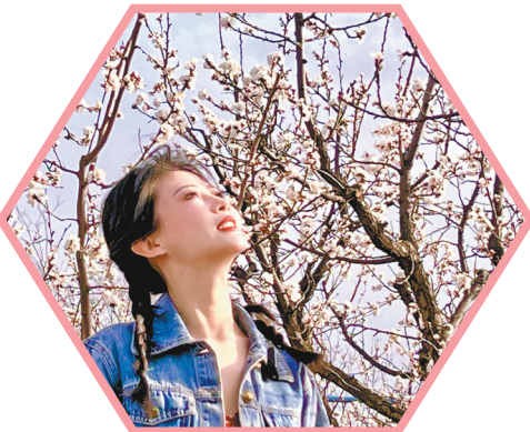
游客们沿着杏花观景步道漫步打卡。

据了解,部分活动持续至4月20日,旨在推动“赏花经济”向全域旅游深度延伸,让文化活起来、消费热起来、乡村火起来,带动周边农户增收,助力打造土默特右旗春季文旅标杆品牌。