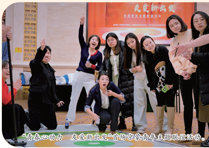
“青春心动力 友爱新出发”首场京蒙青年主题联谊活动。

接下来，自治区团委将以区域合作深化行动为抓手，深化京蒙两地共青团合作交流，为助力内蒙古办好两件大事注入澎湃青春动力。