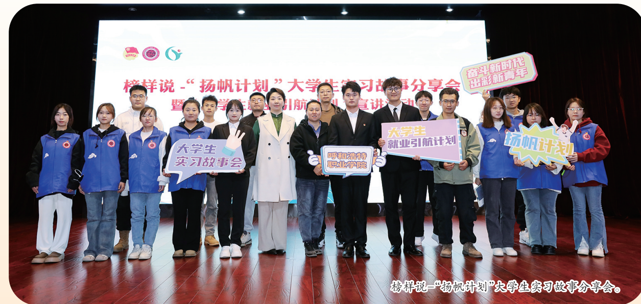
榜样说“扬帆计划”大学生实习故事分享会。

能力锻造，实践平台赋能职业竞争力。依托“扬帆计划”这一核心载体，构建起贯穿在校实习、技能培训、职场体验的实践育人网络。2023年启动至今，累计发布实习岗位7万余个，4万余名青年学生踏上实习岗位，引领青年在参与乡村振兴、数字经济等实践项目中锤炼专业技能。通过“微中学、学中创”的闭环培养机制，让青年在实战中校准职业方向，为产业链升级储备了适配人才。