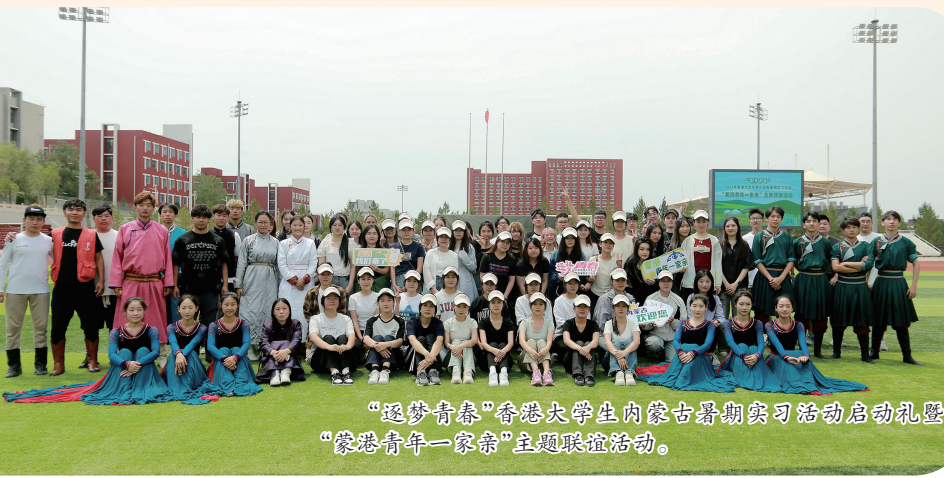
“京蒙青年守望北疆——巴彦淖尔市暨青春助力‘三北’工程建设系列活动”启动仪式。