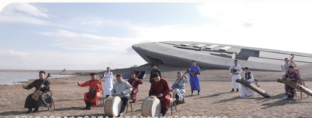
内蒙古艺术学院学生赴库布齐沙漠开展“北疆文化建设和提升行动”主题活动。