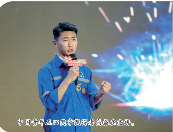
中国中五四段中德能源项目在致辞。