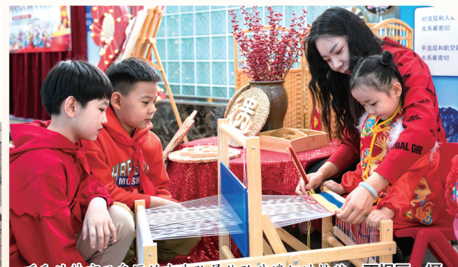
青年歌手在库布齐沙漠开展“北疆文化的青春DNA动了”主题活动。

北疆文化是中华文化宝库中的璀璨明珠，蕴藏着北疆儿女守望相助、坚毅坚韧的精神基因，彰显着新时代内蒙古青年守正创新、挺膺担当的价值追求。自治区团委将推动北疆文化创造性转化创新性发展作为践行自治区党委“六个行动”部署的重要举措，团结带领全区广大团员青年争当北疆文化的传承者、建设者、开拓者，在新时代征程下闪亮青春印记。