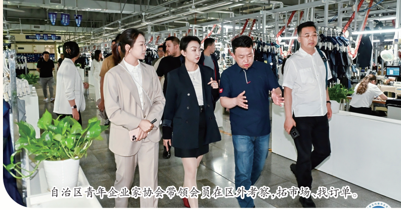
自治区青年企业家协会会员在区外考察、拓市场、找订单。

自治区团委通过一系列行之有效的举措，为青年企业家的成长铺就坚实道路，为企业发展注入强劲动能。未来，自治区团委将继续发挥自身优势，汇聚各方力量，为企业创造更多发展机遇，助力企业在市场竞争中脱颖而出，为内蒙古经济的繁荣发展贡献更多青春力量。