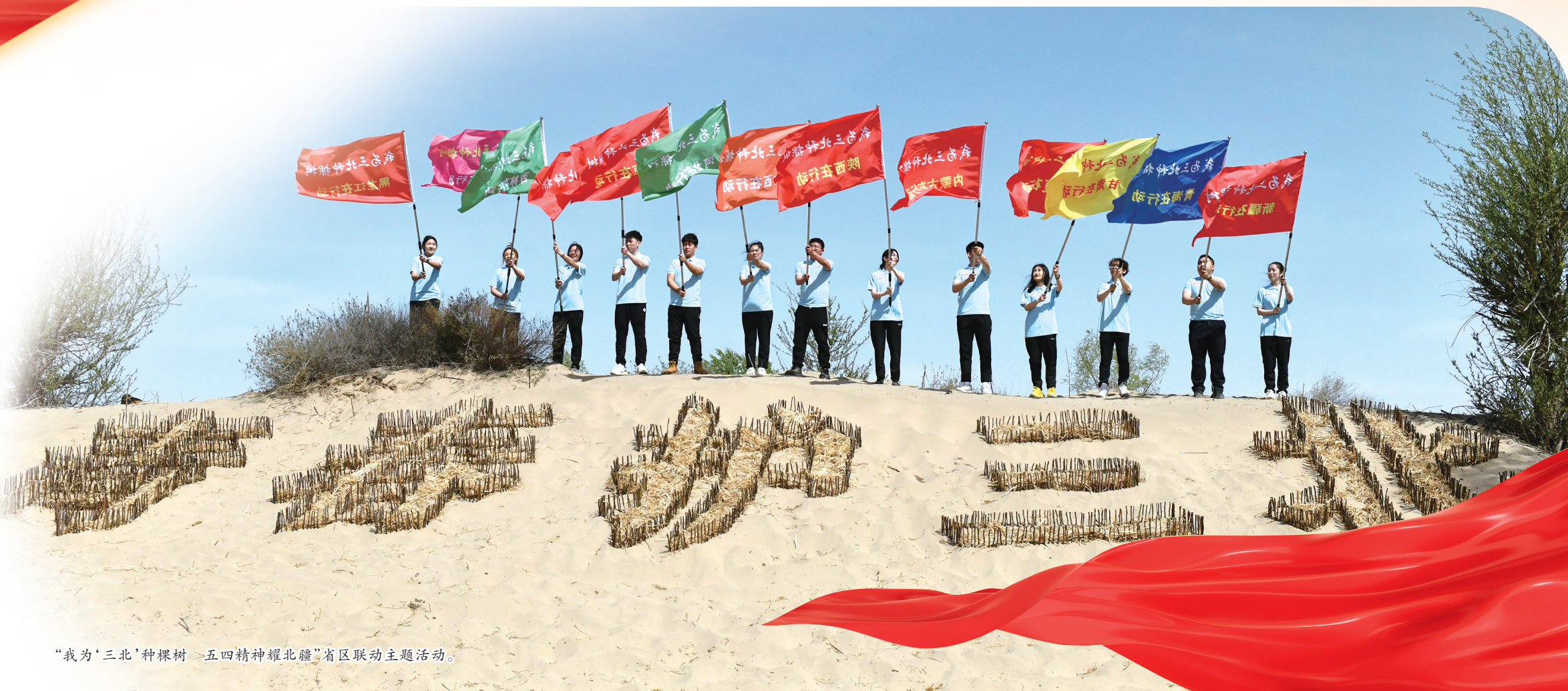
“我为‘三北’种棵树”五四精神耀北疆”省区联动主题活动。

下一步，自治区团委将更加紧密地团结在以习近平总书记为核心的党中央周围，在自治区党委和团中央的坚强领导下，团结引领广大北疆青年奋进新征程、建功新时代，拿出实干拼搏、只争朝夕的好作风，主动融入高质量发展大局，为书写中国式现代化内蒙古新篇章挺膺担当。