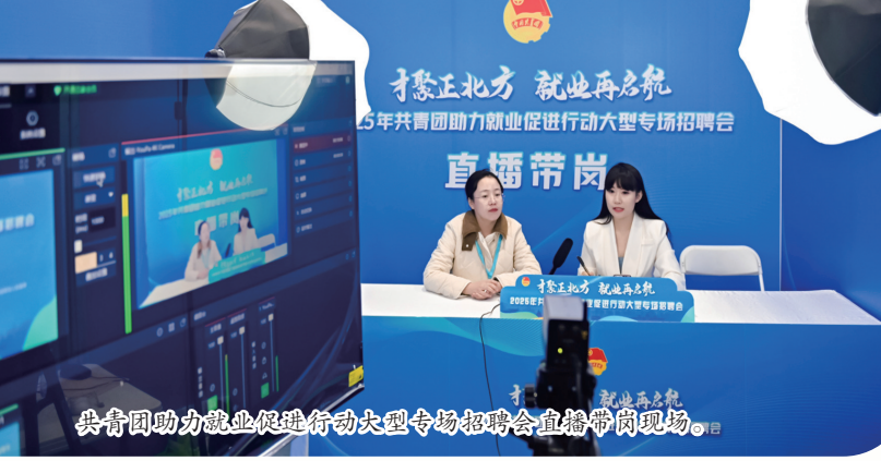
共青团助力就业促进行动大型专场招聘会现场指导岗位。