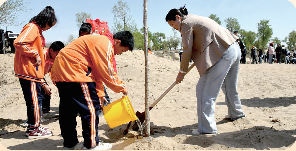
少先队员在五原县塔尔湖镇参加“我为‘三北’种棵树 五四精神耀北疆”省区联动主题活动。

响应的立体化治理网络。如同青年志愿者在黄河岸边种下的红柳林那般，节水护绿不仅要深挖根系系源技术根基，也要舒展枝叶延伸文化脉络，需花果飘香结出制度硕果。当42万青年成为“行走的生态路由器”，内蒙古正成为美丽中国建设提供可复制的青春方案——以科技创新为引擎，以文化传承为纽带，以机制变革为支点，撬动生态文明建设的绿色北疆。