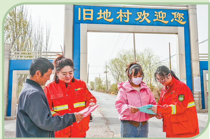
队员们在田间地头进行防火治沙宣传。