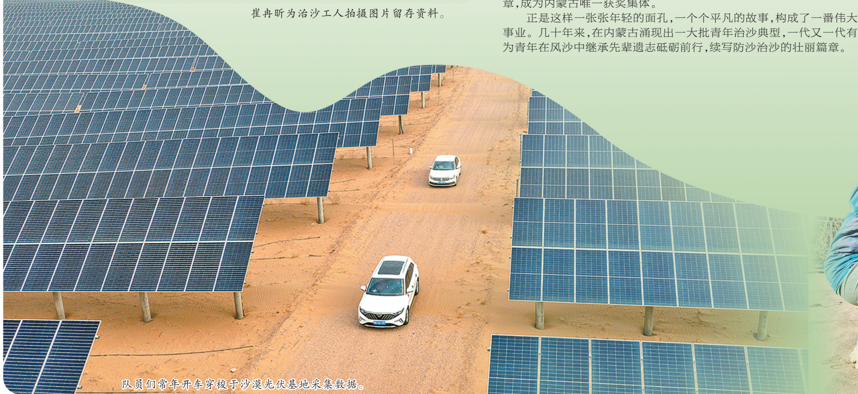
队员们常年开车穿梭于沙漠光伏基地采集数据。