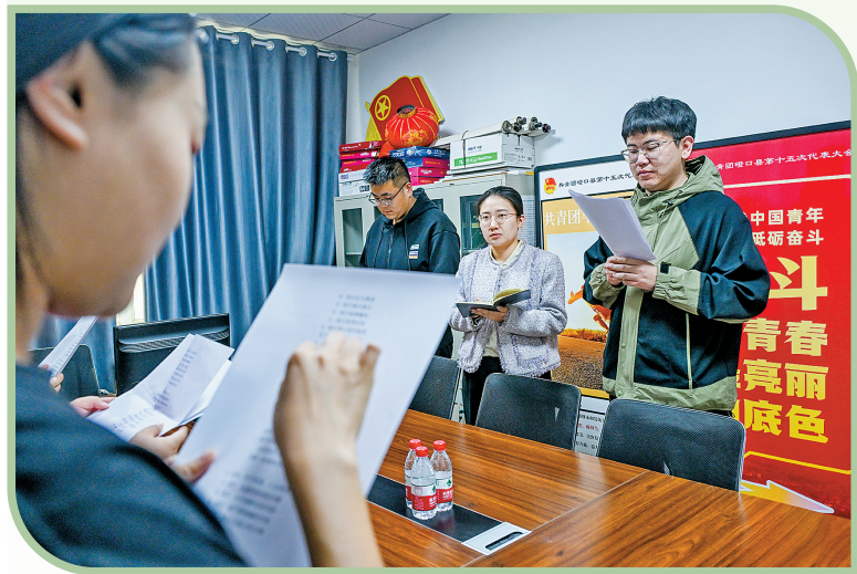
青年突击队队员熟悉宣讲材料。