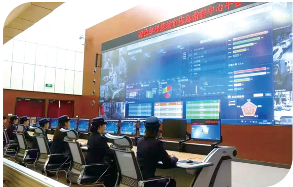
海拉尔区智慧化城市管理将城市不断升级。