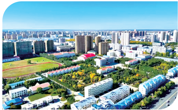
海拉尔区城市景观。