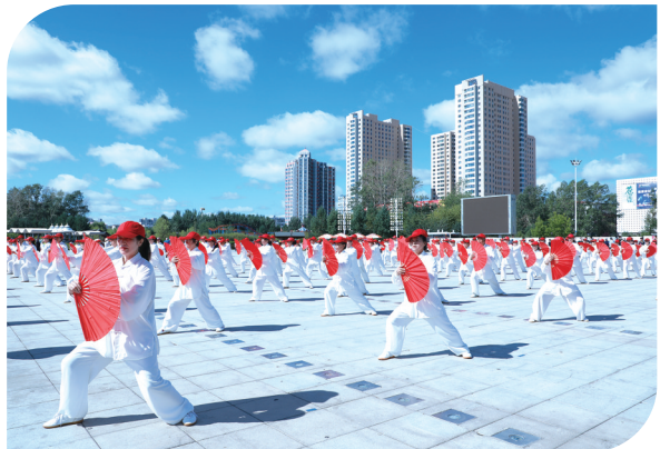
成吉思汗广场健身活动。