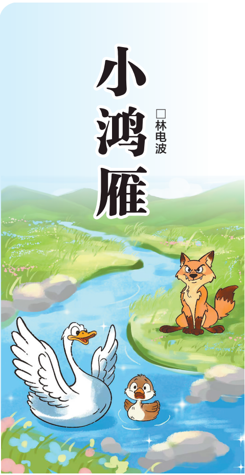
白天鹅妈妈与小鸿雁 (水彩画) 林路