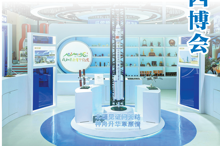
展示内蒙古与中国航天的情缘。