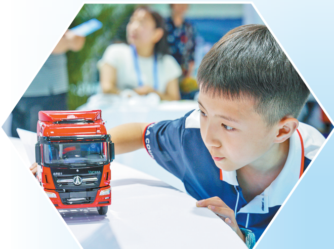
小朋友被重卡模型所吸引。

本届西博会举办期间,内蒙古在成都举办了内蒙古重点产业座谈交流会,聚焦新能源、装备制造、生物医药等重点产业开展精准招商对接,同时组织盟市投促部门工作人员前往四川川润数字能源科技有限公司、成都伟力得能源股份有限公司、特锐德川开电气有限公司进行考察对接。