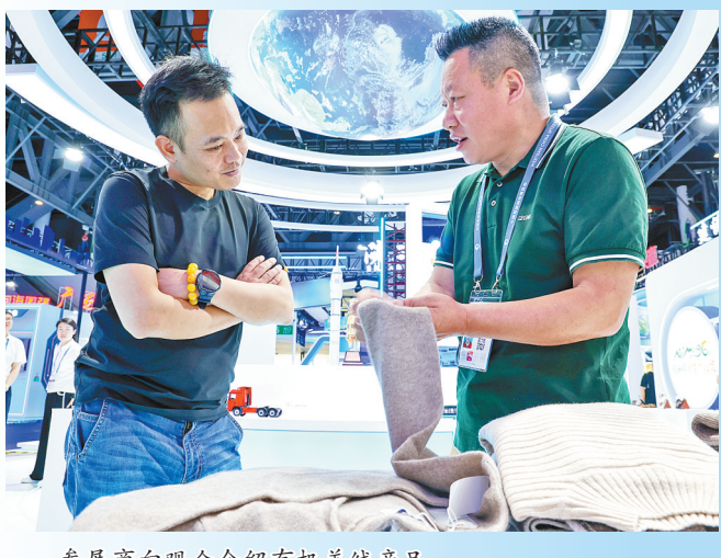
参展商向观众介绍有机羊绒产品。