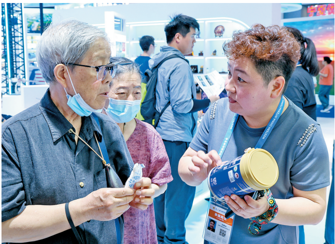
参展商向观众介绍奶制品。