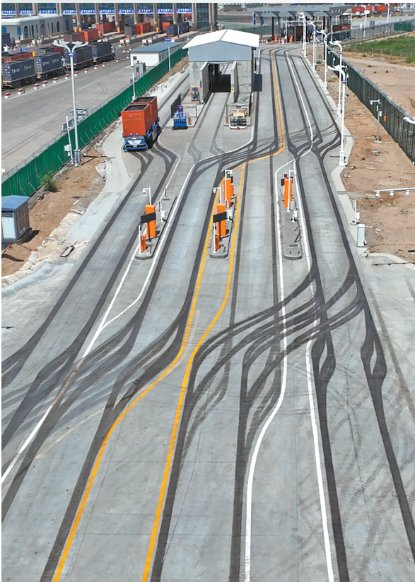
埋设磁钉的跨境封闭公路。

从磁钉导航到无人巡逻,甘其毛都口岸的智能化实践,不仅破解了传统跨境运输的堵点,更探索出一条“智慧边检+数字国门”的高效通关新路径。