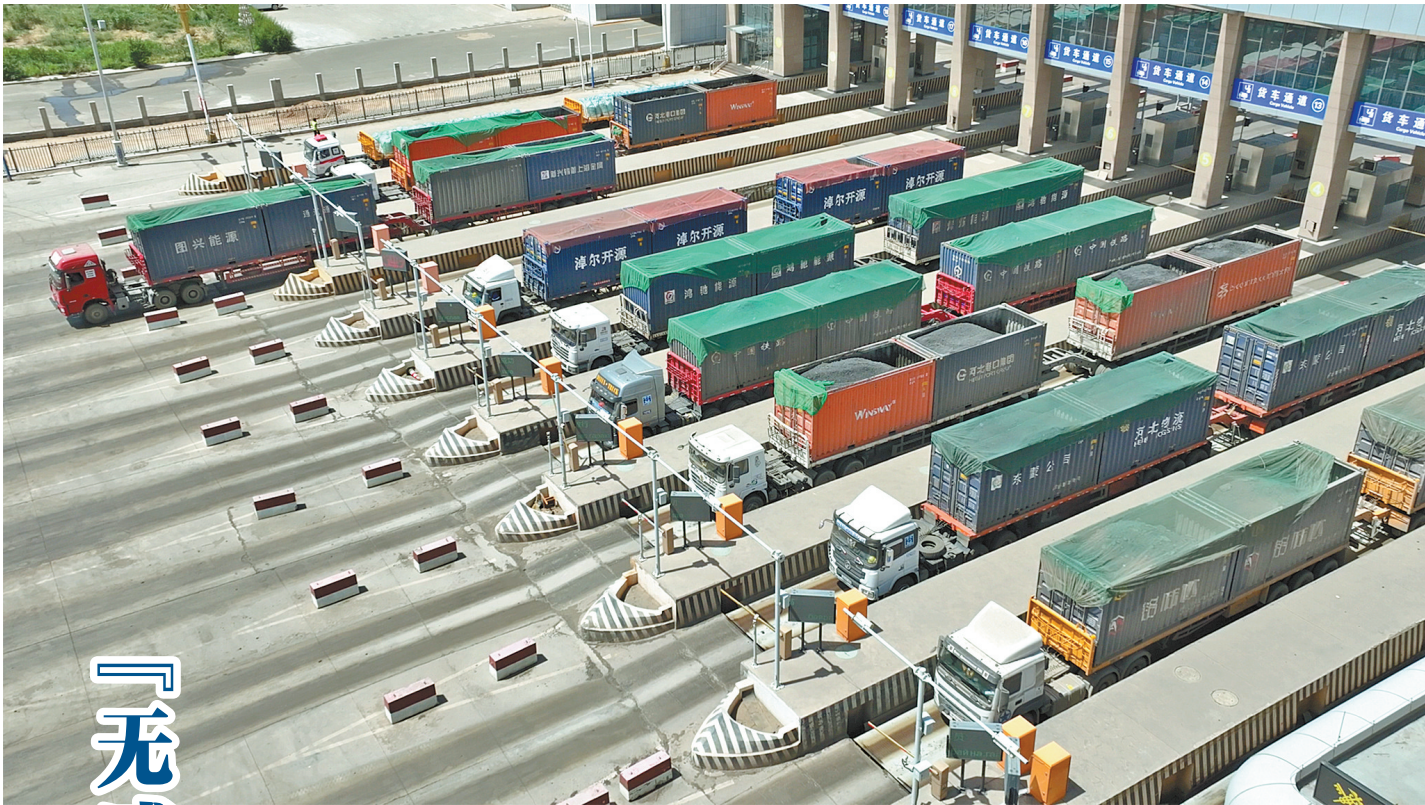
等待过检的货运车辆。