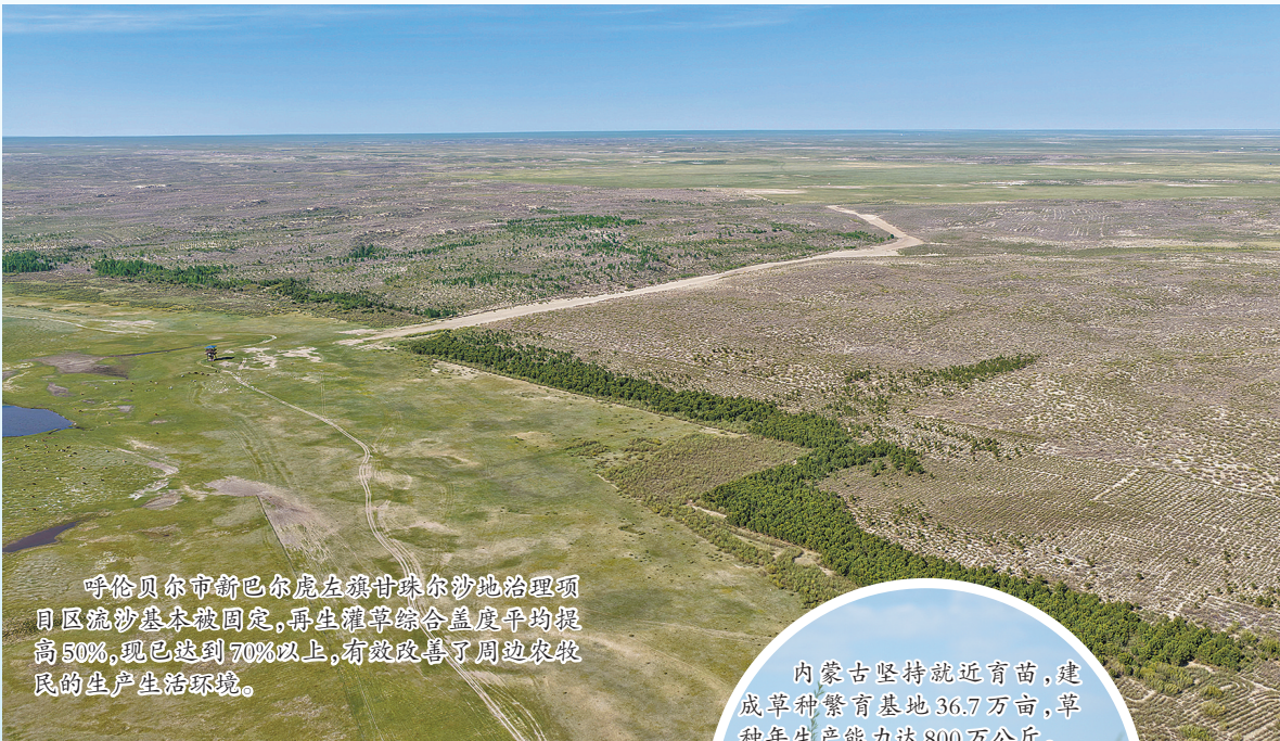
呼伦贝尔市的巴林左旗甘其毛都沙地治理项目区,虽然沙区面积较大,但治理项目启动后,沙区已得到明显改善,周边农牧民的生产生活环境。