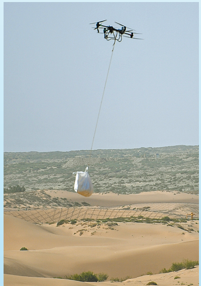
在鄂尔多斯市鄂托克旗黄河“几字弯”攻坚战毛乌素沙地下风口阻沙带项目现场,无人机正在吊运制作沙障的材料。