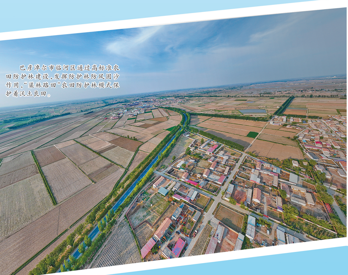
巴彦淖尔市临河区通过高标准农田防护林建设,发挥防护林防风固沙作用,“渠林路田”农田防护林模式保护着沃土良田。