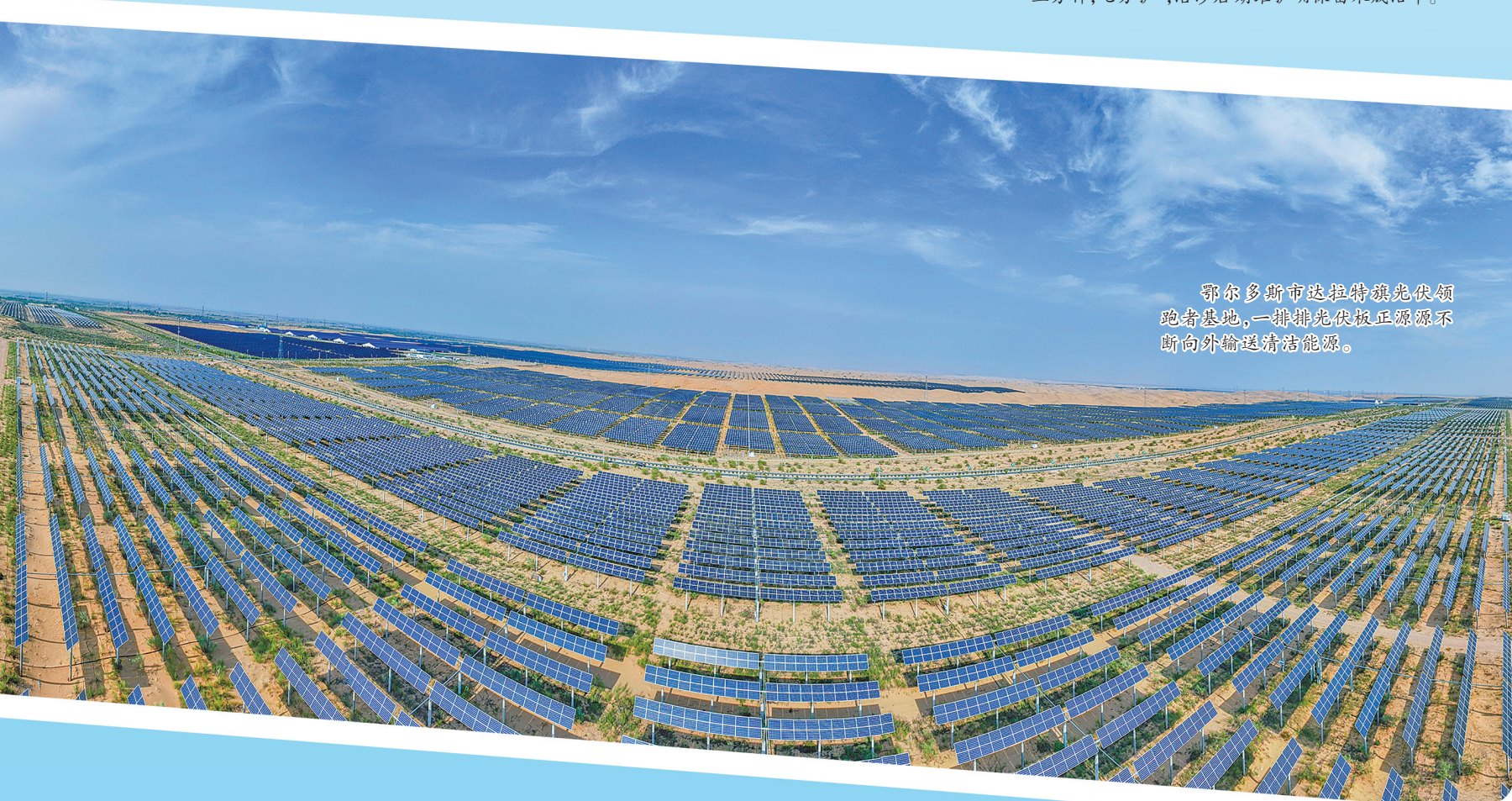
鄂尔多斯市达拉特旗光伏领跑者基地,一排排光伏板正源源不断向外输送清洁能源。