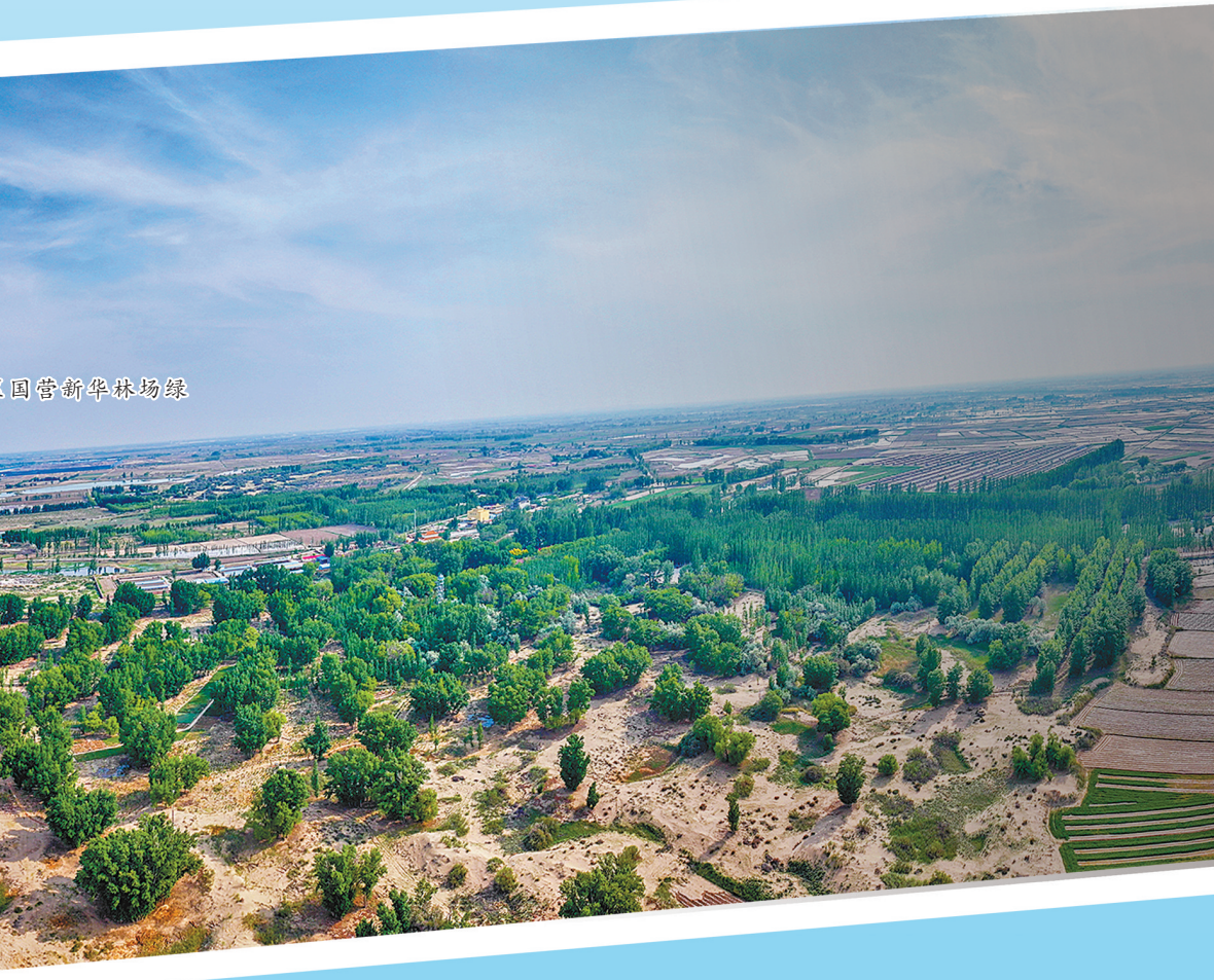
巴彦淖尔市临河区国营新华林场绿染盎然,生机勃勃。