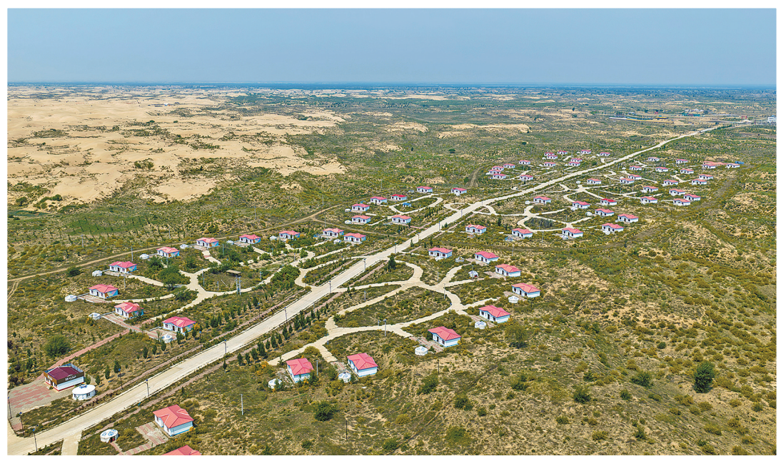
通辽市奈曼旗地处科尔沁沙地腹地,是科尔沁沙地治理核心区。经过多年治理,生态环境、固沙成果明显改善,成效显著。