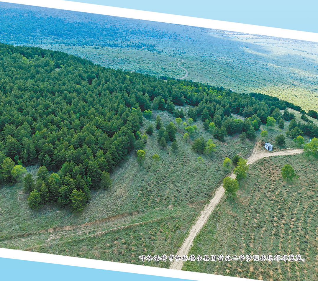
呼和浩特市和林格尔县四管乡三台沙地项目治理成效显著。