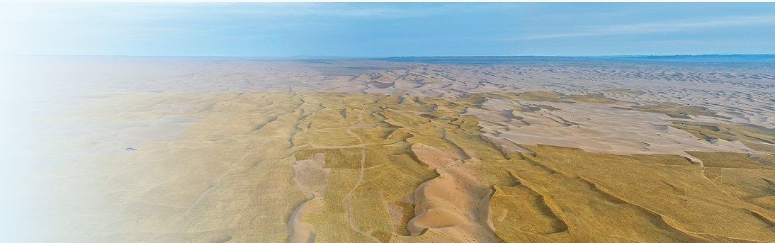
阿拉善盟九棵树的防沙治沙综合治理区绿进沙退。