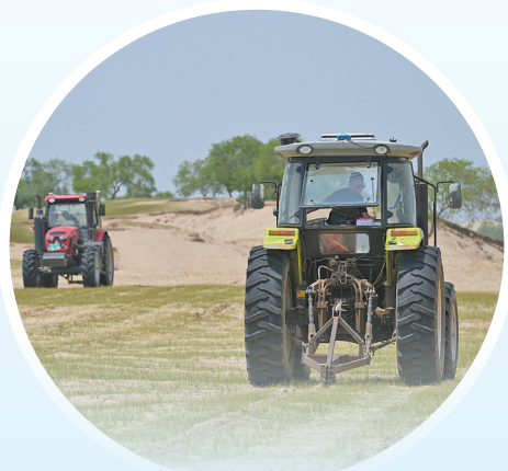
锡林郭勒盟正蓝旗投入大型机械设备,工作效率较人工提高3-5倍以上,治沙更高效、更精准、更便捷。

在多年防沙治沙实践中,内蒙古各地不断创新完善治沙模式,积极探索以路治沙、科技治沙、机械治沙、光伏治沙、以工代赈、先建后补等新机制,激励引导更多力量参与工程建设。内蒙古通过科技创新与机械化应用实现了治沙效率和精准度的显著提升。一方面,积极推广滴灌、微灌、容器苗等高效节水治沙技术,实施15个防沙治沙科技创新重大示范工程项目揭榜挂帅攻关,破解防沙治沙技术瓶颈;另一方面,全面推广应用灌木平茬机、智能沙障铺设机械、无人机飞播等先进适用新技术、新装备,推动防沙治沙由“人海战术”加快向机械化作业、智慧化治理转变。 值得一提的是,内蒙古立足风光资源和“沙戈壁”土地资源,将防沙治沙与新能源开发深度融合,以“光伏发电+生态治理+板下经济”的立体模式,实现增绿、增能、增收多赢。2024年,防沙治沙和风电光伏一体化工程完成治沙238万亩,配建新能源装机2727万千瓦。 按照“生态产业化、产业生态化”的发展思路,内蒙古大力发展特色林果、沙生中药材、灌木饲料、沙漠旅游等特色产业。2024年,全区林草产业总产值突破1000亿元。特色林草产业加快发展,生态资源不断增加,农牧民持续增收,实现了由绿变美、由美而富的华丽转变。 增绿就是增优势,护林就是护财富。滚石上山,久久为功,“三北”的绿意还在绵延铺展。