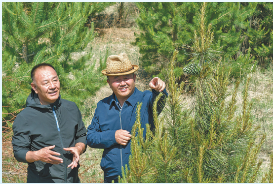
赤峰市翁牛特旗在多年防沙治沙实践中探索总结出“以路治沙、依路致富”模式,以路为基,把沙地切割成若干个治沙区域,分而治之,阻断沙地流动。