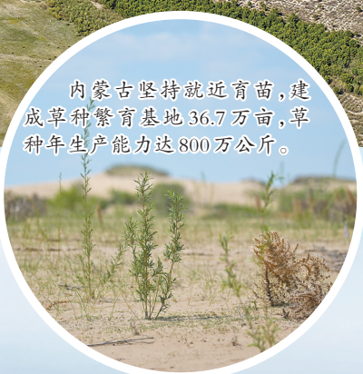
内蒙古坚持就近育苗,建成草种繁育基地36.7万亩,年种年生产能力达800万公斤。