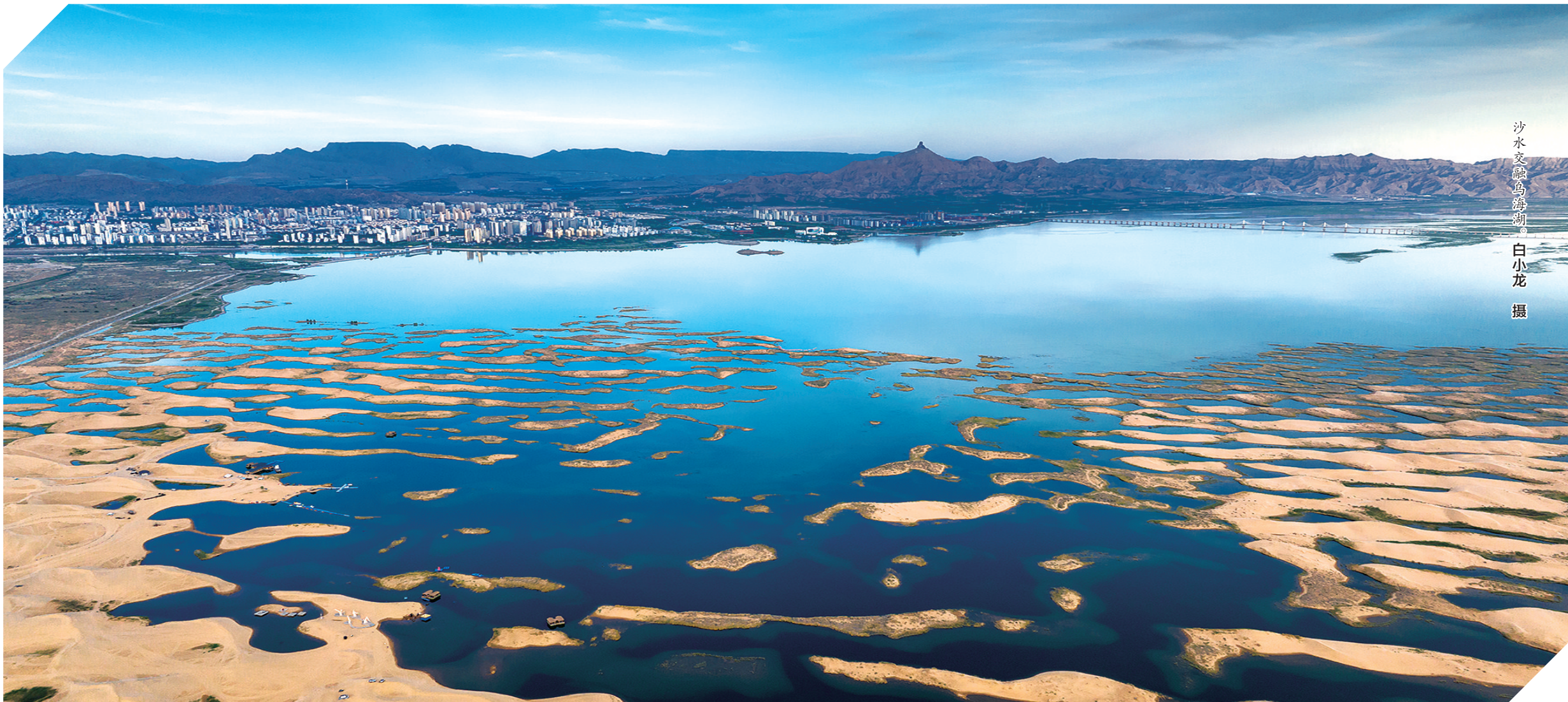
沙水交融乌海湖。