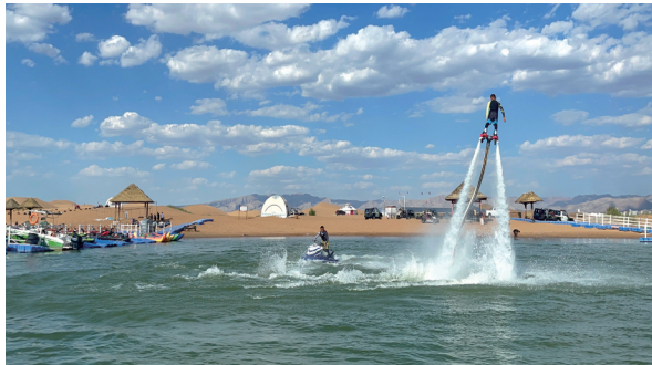
乌海湖西岸的游玩项目。