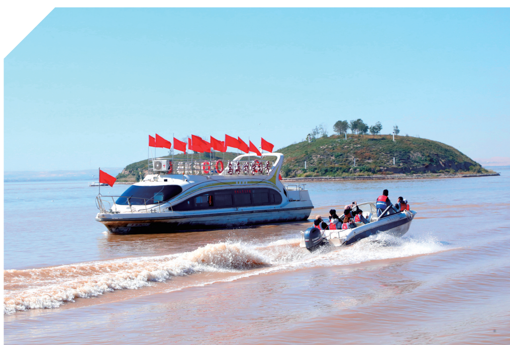
坐船游览乌海湖。