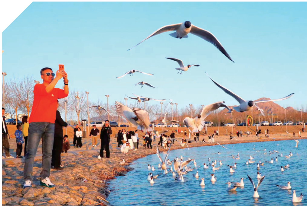
红嘴鸥光临乌海湖。

夕阳西下,暮色中的乌海湖令人沉醉,金沙与碧水在晚风里低语,候鸟的翅膀掠过泛金的波光,这里既承载着生态文明的希望,又寄托着文旅融合的梦想。乌海湖,正以它独一无二的魅力,向世界发出最诚挚的邀请。