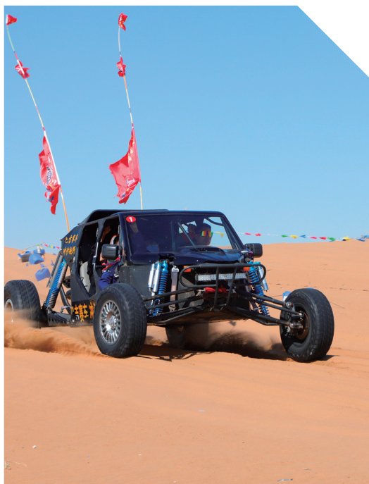
体验沙漠越野的刺激。