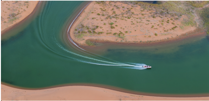
快艇在沙海中穿梭。