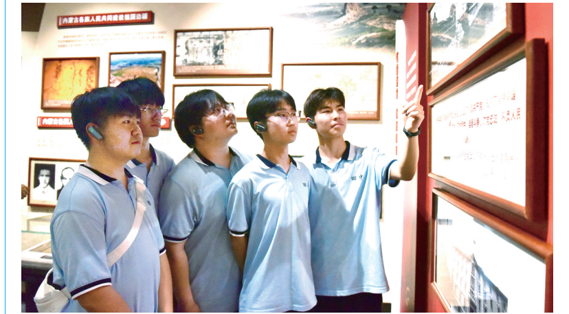
了解档案工作 厚植家国情怀

值得关注的是，该公路实现武川县5个乡镇全以一级公路联通，为呼和浩特“强首府”工程筑牢交通支撑。此前，交通通达性不足制约着武川县资源优势转化与经济社会发展，而S311武川至杨树坝一级公路（呼和浩特市段）建成通车彻底扭转了这一局面。它不仅提升道路通行能力与安全水平，更让武川及沿线地区能更好承接首府辐射，为特色产业发展装上“加速器”。