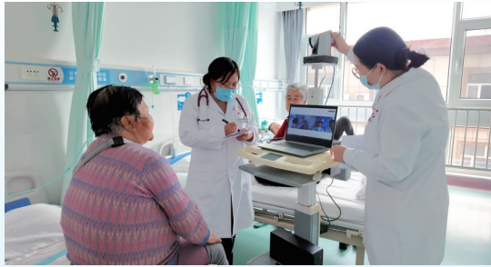
不断健全医疗卫生服务体系。