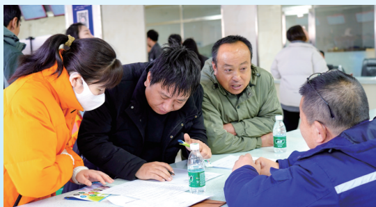
深入推进就业促进行动。