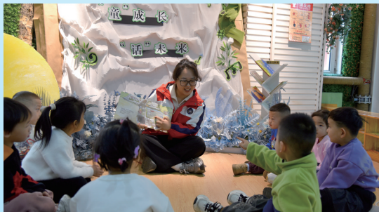
海南区第一幼儿园,教师在为孩子们讲故事。