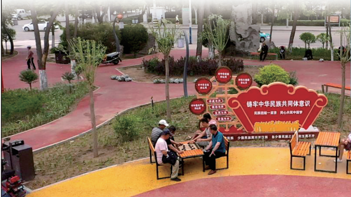
家门口的口袋公园。