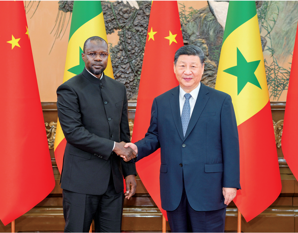
6月27日上午，国家主席习近平在北京人民大会堂会见来华出席夏季达沃斯论坛的塞内加尔总理松科。

新华社北京6月27日电（记者 邵艺博）6月27日上午，国家主席习近平在北京人民大会堂会见来华出席夏季达沃斯论坛的塞内加尔总理松科。 习近平指出，去年9月，我同法耶总统一道主持中非合作论坛北京峰会，引领中非关系进入共筑新时代全天候命运共同体的新阶段。中塞两国是发展振兴的同路人、好兄弟。中方愿同塞方加强团结合作，深入推进中塞全面战略合作伙伴关系，为两国人民带来更多福祉，为中非友好和全球南方