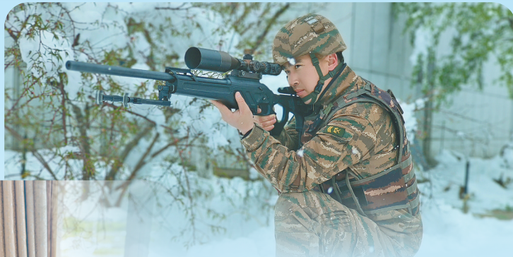
明胜进行狙击手腕姿势据枪定型训练。