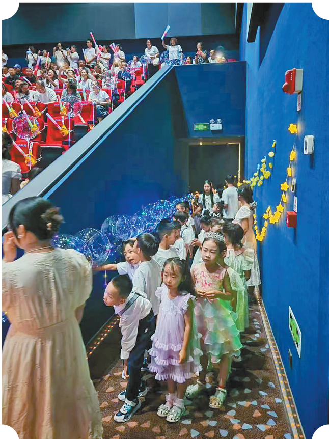
小朋友们等待入场。

这个暑期档,动画电影不仅为小朋友们带来欢乐,也成为亲子互动的绝佳选择,让孩子们在电影的奇妙世界里开阔视野、收获感动,并在光影世界中度过一个充实的假期。