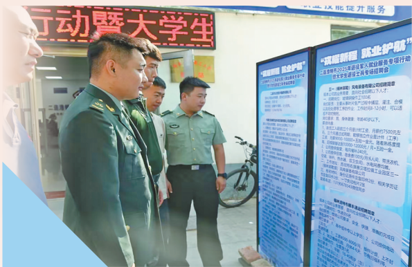
退役军人了解招聘信息。