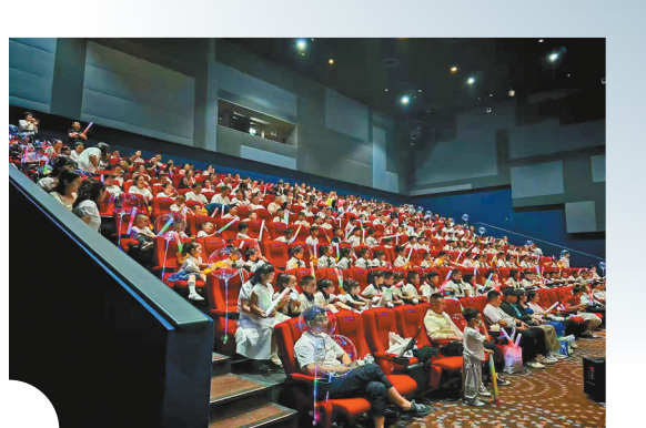
观众走进影院,乐享假期。