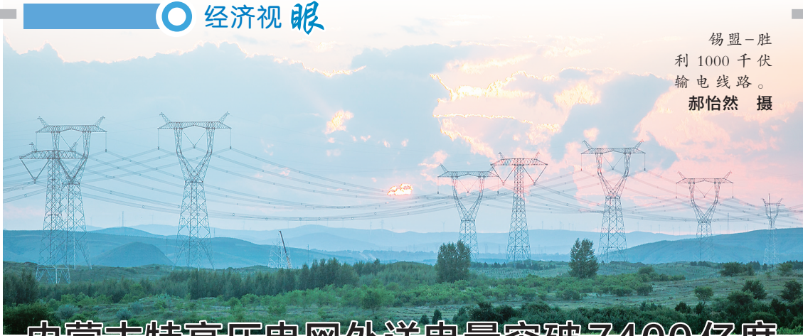
锡盟-胜利1000千伏输电线路。