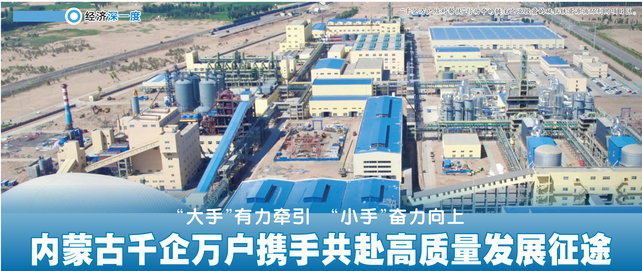
“千企万户结对帮扶”行动中的链主企业投资的硫铁矿资源循环利用项目区。