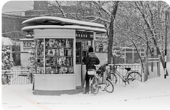
1999年,呼和浩特市街头卖报亭。