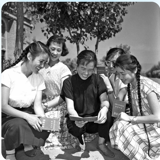
1962年,内蒙古大学第一届毕业生。吉雅 摄

执行主编:夏红 庞俊峰 责任编辑:冯雪玉 刘艳 版式策划:苏昊 制图:安宁 2025年7月15日 星期二