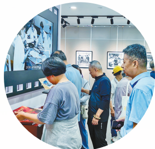
观众津津有味地欣赏图片展画册。