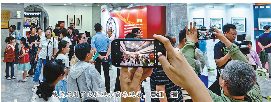
展览吸引了大批观众前来观看。