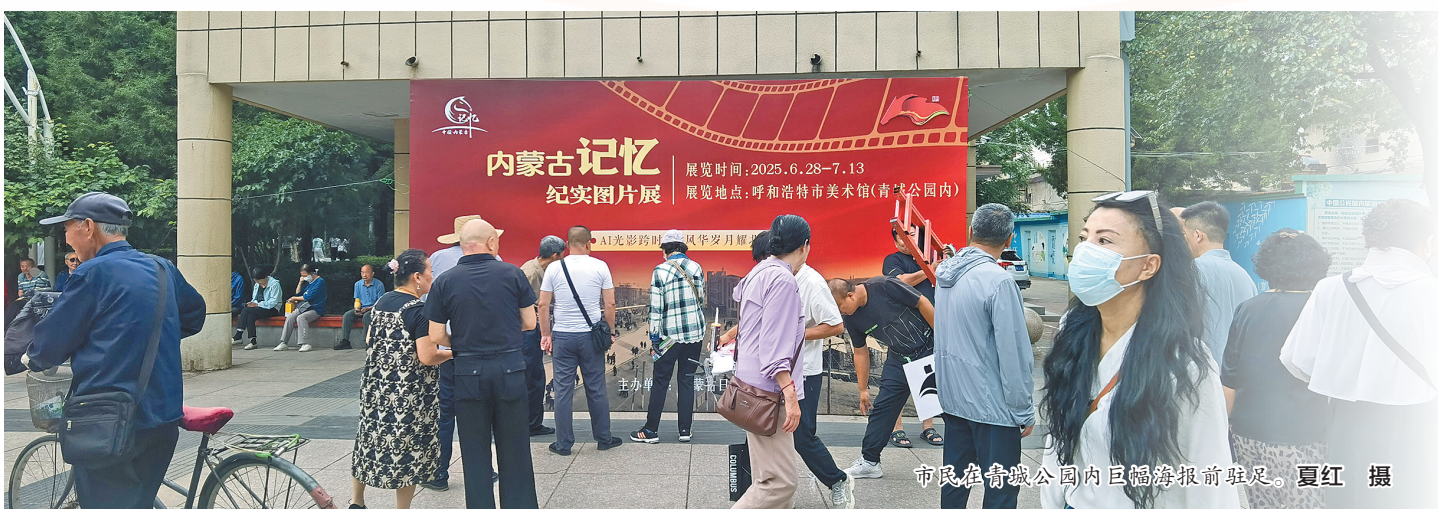
市民在青城公园内巨幅海报前驻足。