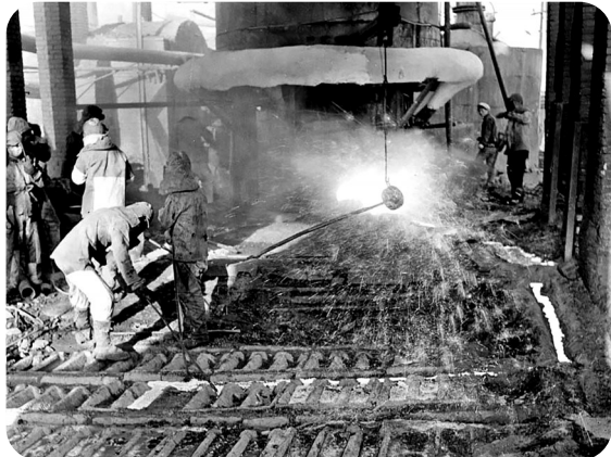
1960年,包钢“青年红旗炉”。