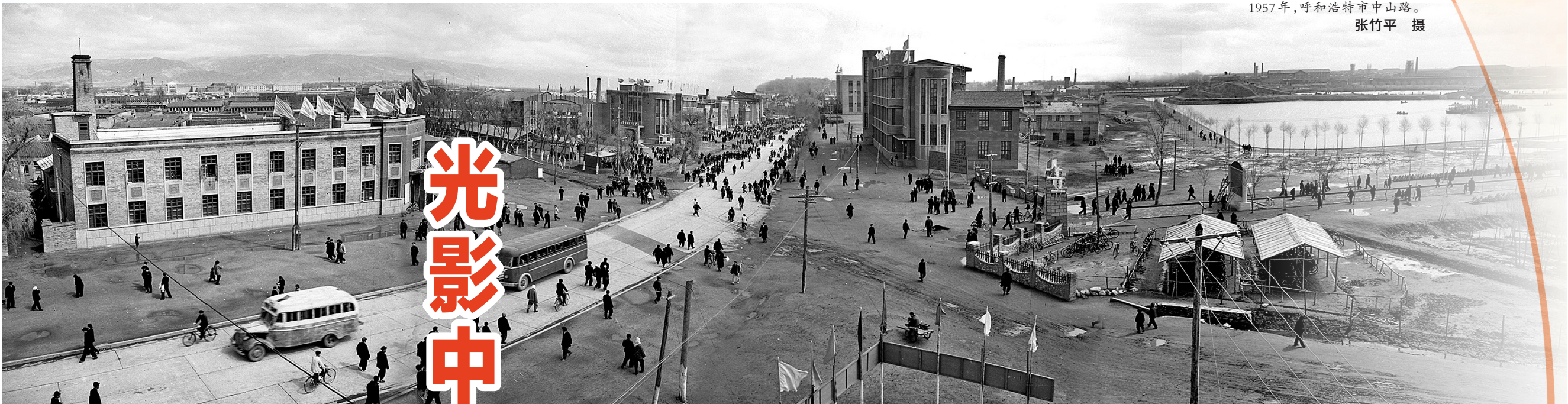
1957年,呼和浩特市中山路。张竹平 摄