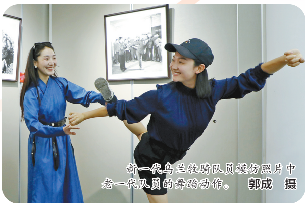
新一代乌兰牧骑队员模仿照片中老一代队员的舞蹈动作。