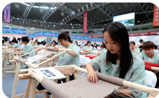
“万人绒绣”展演现场。

如今,鄂尔多斯羊绒制品生产能力已占全国的50%、全球的40%,不仅是中国优质山羊绒原料基地,更成为世界级羊绒制品生产加工中心。