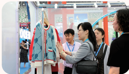
展会现场,优质的产品吸引了众多参展者的目光。