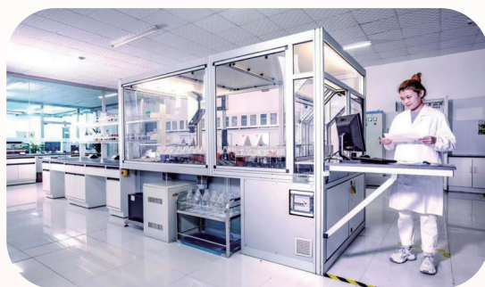
山羊绒材料与工程技术自治区级重点实验室。