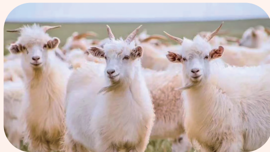
阿尔巴斯白绒山羊。