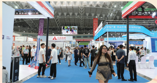
往届中国(鄂尔多斯)国际羊绒羊毛展览会现场。