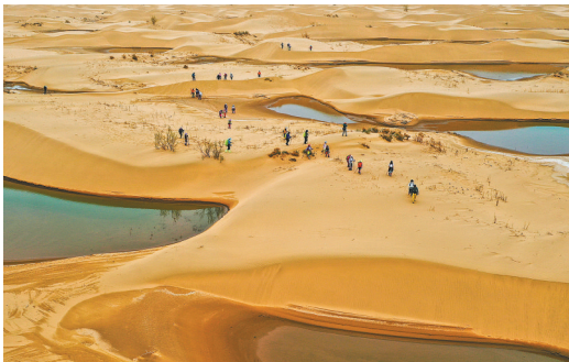
游客在库布其沙漠中徒步。