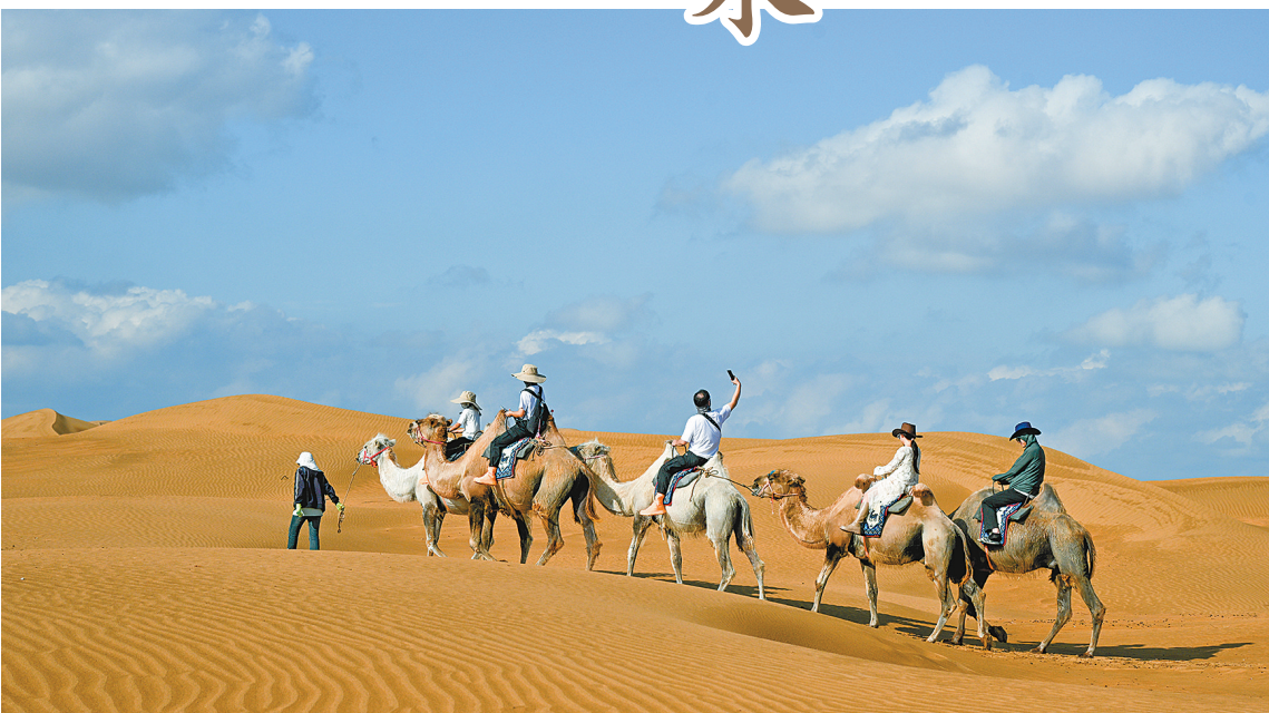
游客骑上骆驼,领略库布其沙漠别样风情。

如今,鄂尔多斯市已建成多个生态旅游景区,形成亮眼的沙漠产业集群,让沙漠旅游焕发持久魅力,让更多的人共享生态红利。