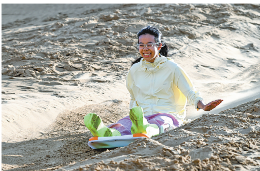
游客体验滑沙项目。