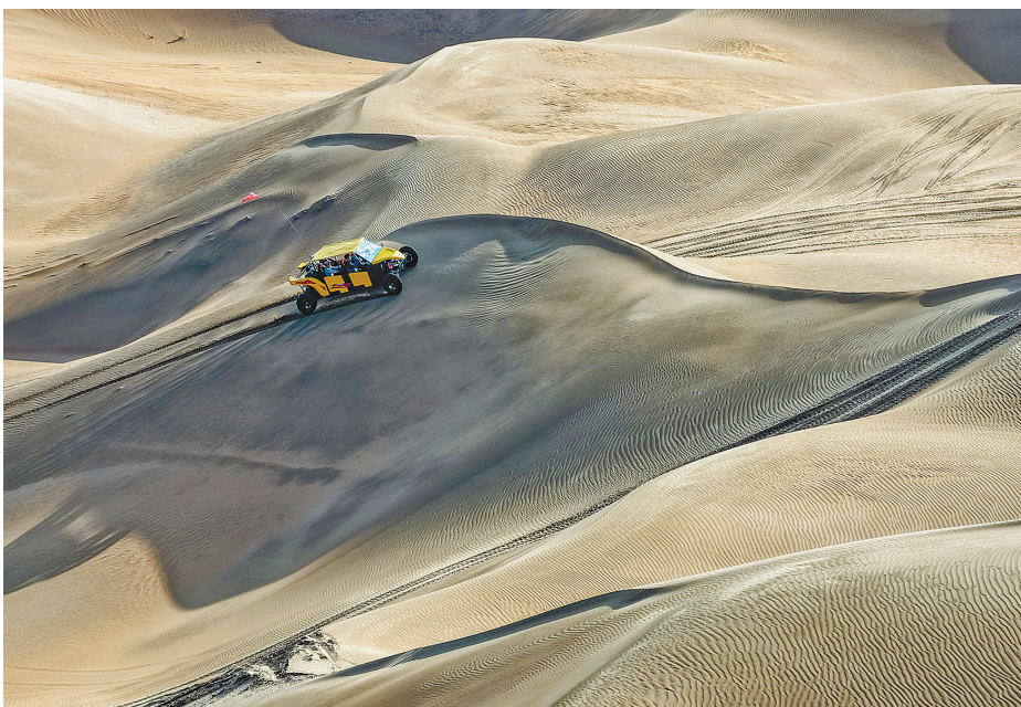
游客体验越野冲浪。