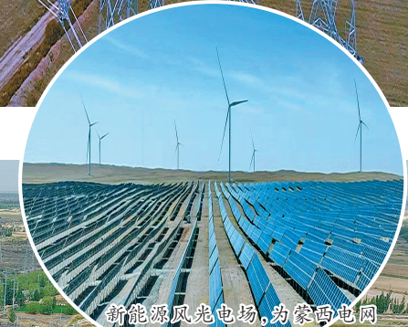
新能源风光电场,为蒙西电网提供源源不断的绿能。龚晨亮 摄