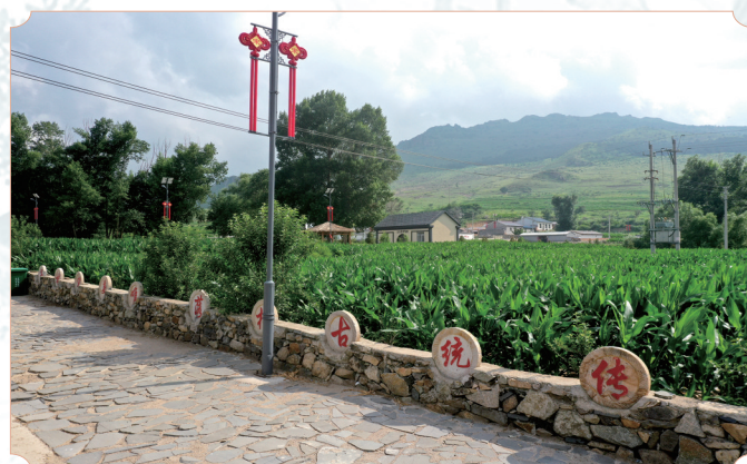
2016年,宋杖子村被评为第三批中国传统古村落遗址。

如今的宋杖子村,既守着旧时光,也迎接新变化。展望未来,在文旅融合的持续推动下,宋杖子村的乡村振兴之路必将越走越宽,成为人们心中留住乡愁的诗意栖居地。