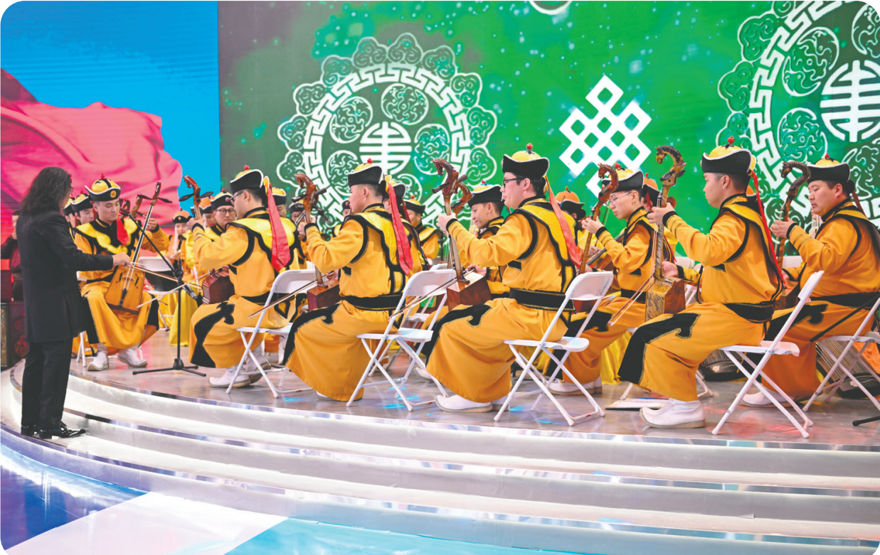
在蒙古国展区,乐手齐奏马头琴。