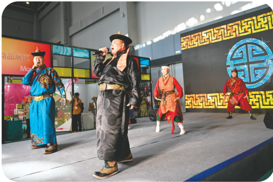
在蒙古国商品展区,歌舞演员带来精彩的文艺表演。