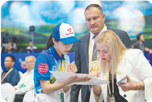
志愿者为外国观众提供咨询服务。