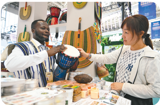
参会者在加纳展区选购非洲鼓。

联接世界,共创未来。中蒙博览会不仅是一次贸易的盛会,更是文化交流、技术碰撞、理念融合的平台。中蒙博览会正以国际化的全新姿态,为中蒙两国及世界各国搭建合作共赢的桥梁。