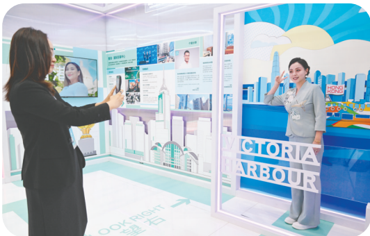
香港特区政府驻北京办事处举办的“三个中心一个高地 服务国家战略 赋能香港未来”主题展览吸引观众拍照打卡。