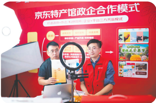
在云上中蒙博览会上,内蒙古线上商品大集展区,主播在线上带货,为本土商品做宣传推广。