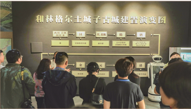
媒体团了解和林格尔土城子古城建置演变过程。