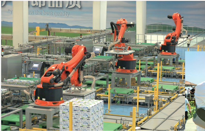
▲ 伊利自动化生产线。

亲河大型全媒体传播活动媒体团一路沿黄河而行,先后深入呼和浩特市、鄂尔多斯市、包头市、巴彦淖尔市、乌海市,实地走访黄河流域生态治理的绿色蜕变,感知高质量发展的强劲脉搏,解码黄河文化的深厚基因,沉浸式体验黄河流域的生态之美、发展之进与文化之魂。