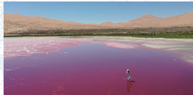
游客在巴丹吉林嘎查的达格图湖(红海子)游玩。

夕阳西下,巴丹吉林嘎查的巴丹吉林庙金顶在余晖中闪耀,诺尔图海子的水面泛着粼粼波光,沙海连绵起伏,沙山壮丽高耸。这座沙漠中的传统村落,凭借世界自然遗产的底蕴、文旅融合的活力、世代相传的守护、与自然共生的智慧,持续焕发出新活力,绽放新光彩。