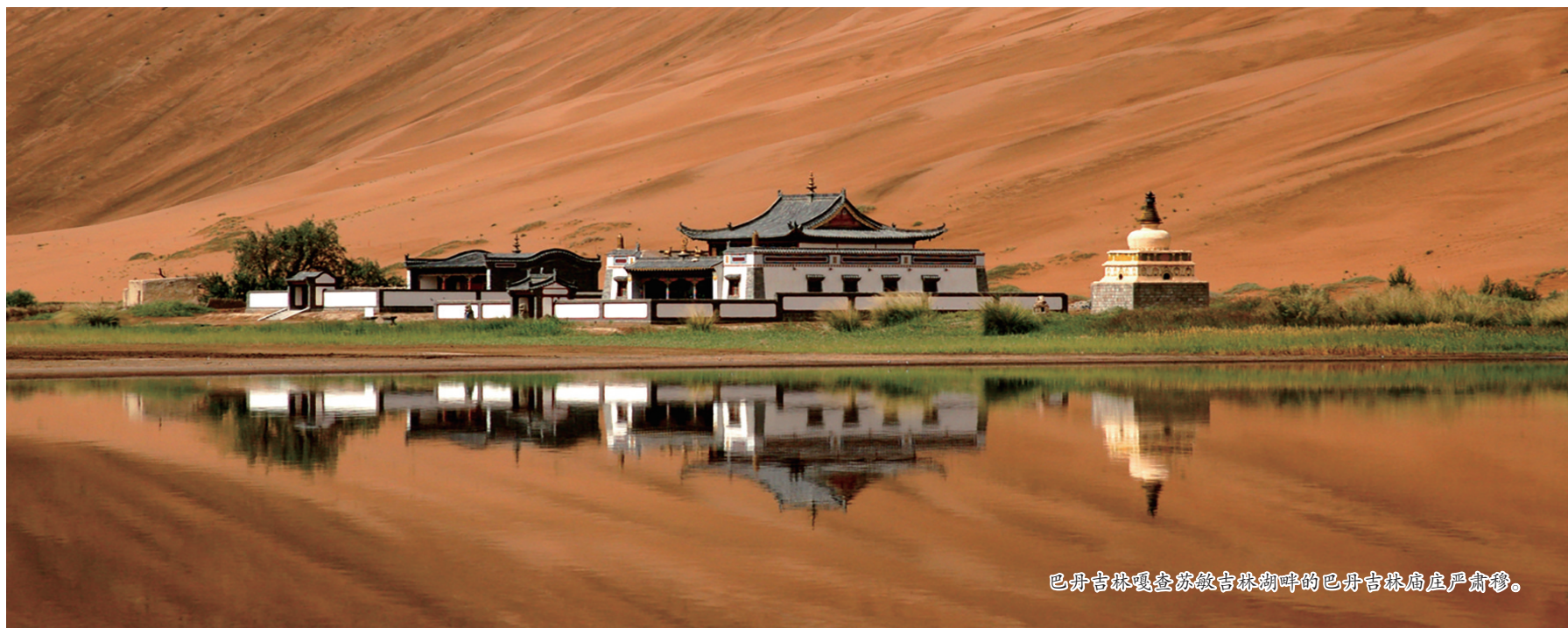
巴丹吉林嘎查苏敏吉林湖畔的巴丹吉林庙庄严肃穆。

从阿拉善盟阿拉善右旗雅布赖镇出发,向西北行驶51公里,翻越连绵起伏的沙山,深入沙漠深处,便来到了巴丹吉林嘎查。在这片3184平方公里的土地上,世界自然遗产“巴丹吉林沙漠——沙山湖泊群”核心区宛如一幅缓缓展开的自然画卷,沙漠与湖泊相依,鸣沙与神泉共生,牧民与沙海相守。这座被列入“第三批中国传统村落名录”“首批自治区乡村旅游重点村”的古老嘎查,正用世界自然遗产的璀璨光芒,讲述着“保护与发展共赢”、人与自然和谐共生的新时代故事。