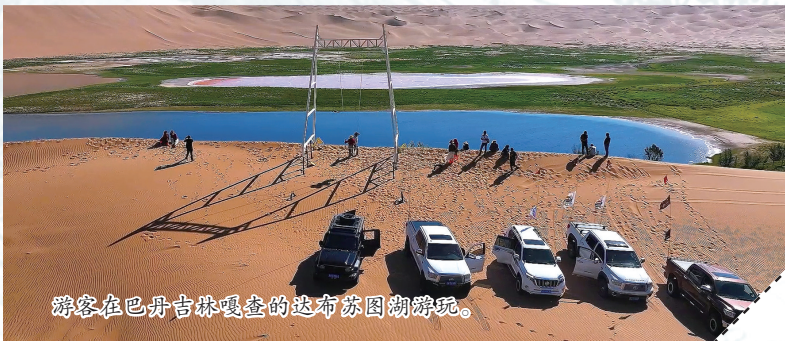
游客在巴丹吉林嘎查的达布苏图湖游玩。