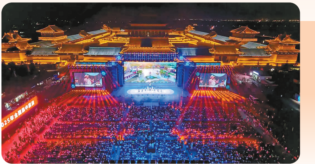
2025年“村歌嘹亮”全国集中展演闭幕式活动现场。

这种协同机制证明:乡村文化“自建”不是“闭门造车”,而是“开门共建”。村民提供文化内核,专业力量提供技术支持,两者结合才能让乡村文化既“接地气”又“有活力”。