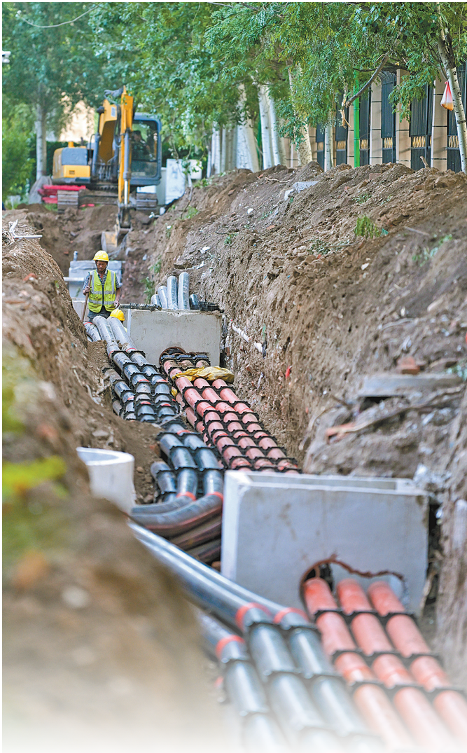
施工人员埋设管道。