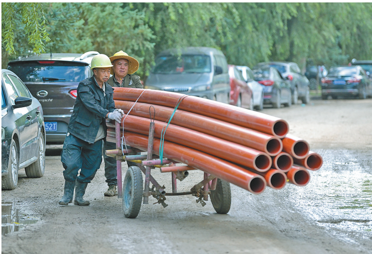
施工人员搬运施工材料。