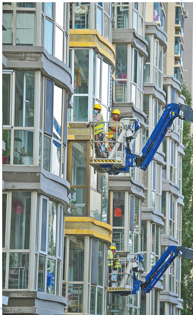
施工人员改造楼体外墙。

老旧小区改造,既是民生工程,也是人心工程。2025年,呼和浩特市计划推进272个城镇老旧小区改造,涉及1107栋楼,5.34万户居民。目前,所有小区已全面进场施工,预计今年9月底陆续焕新收官。