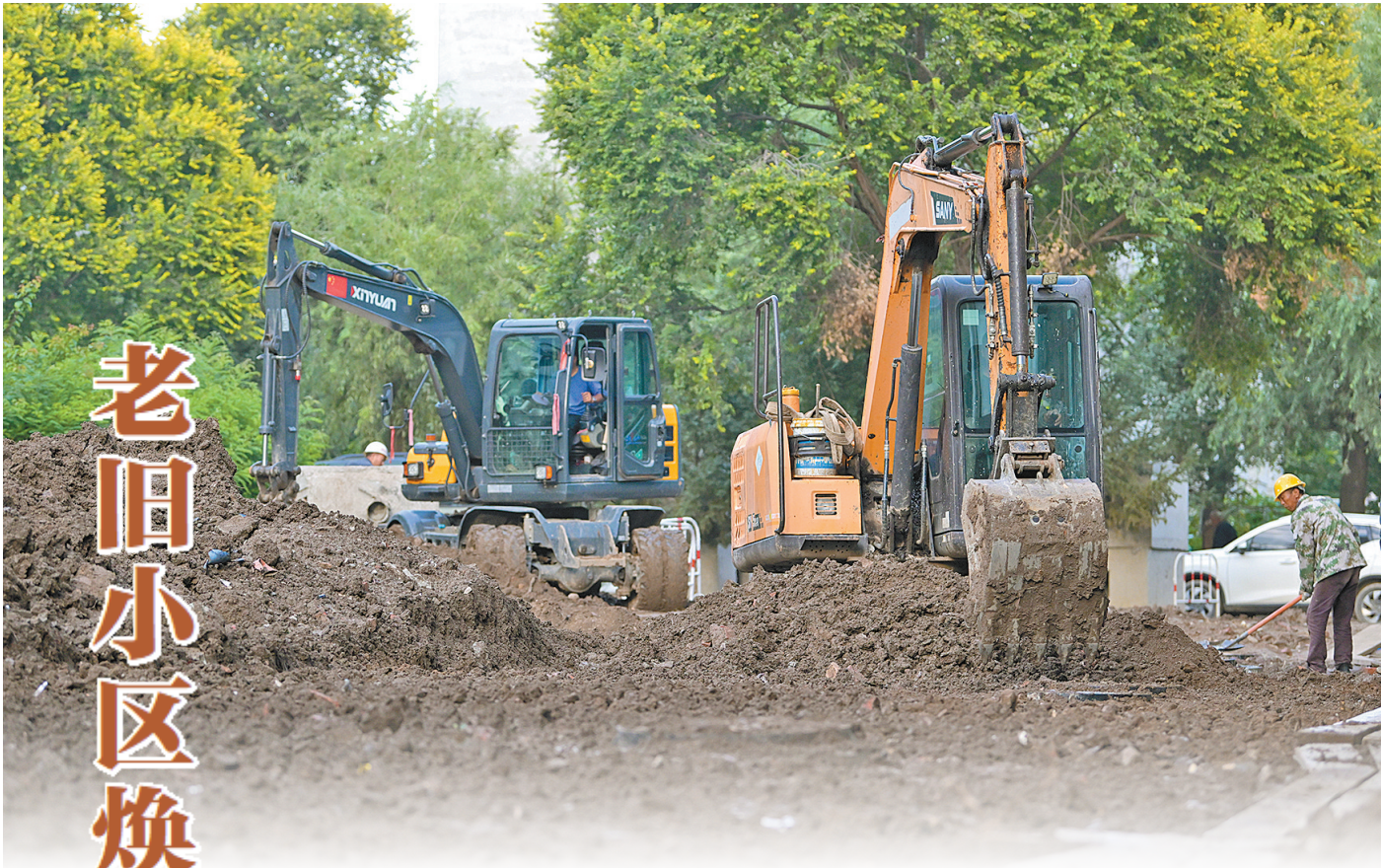
施工人员改造小区内道路。