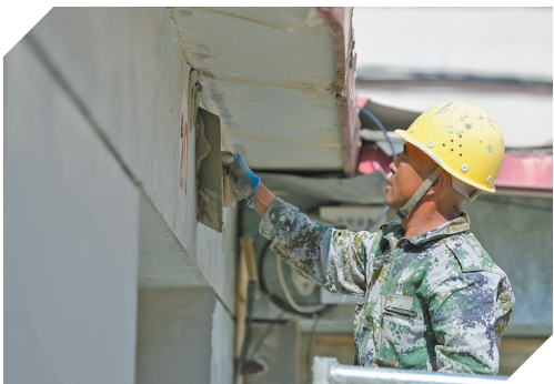
施工人员修复改造小区内墙体。