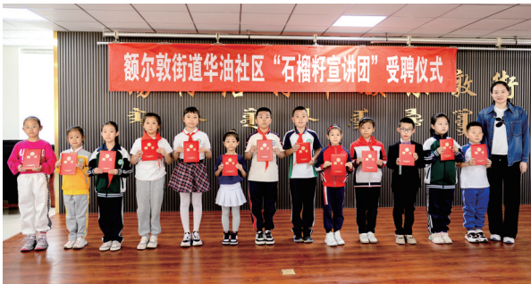
锡林浩特市额尔敦街道华油社区聘任辖区中小学生对“红石榴”宣讲员。