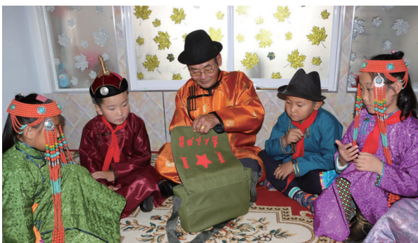
苏尼特右旗桑宝拉格苏木巴彦乌拉嘎查老党员为青少年讲“红书包”送学服务故事。

深化京蒙协作机制,签订产销合作协议5000万元,组织2300名各民族青年赴京津冀地区就业创业,双向流动人口年均增长率保持15%。在创新链突破上,成功落地风光储氢装备制造等填补产业空白的重点项目21个,建成5G基站4658座,精心培育“数字牧场”示范点45个,开展各类技能培训8000人次,农牧民电商直播带货年销售额突破亿元,新业态成为当地群众增收的重要新引擎。