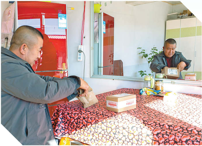
前来取件的村民拆解快递包裹。