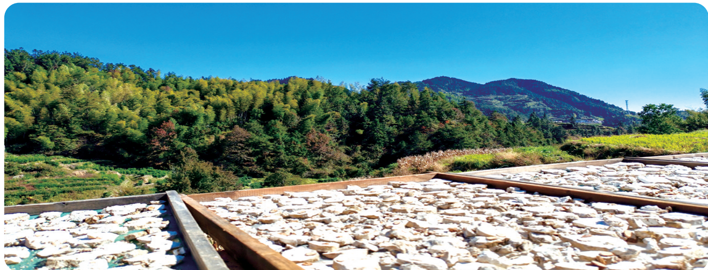
岳西县也是茯苓的主产地。