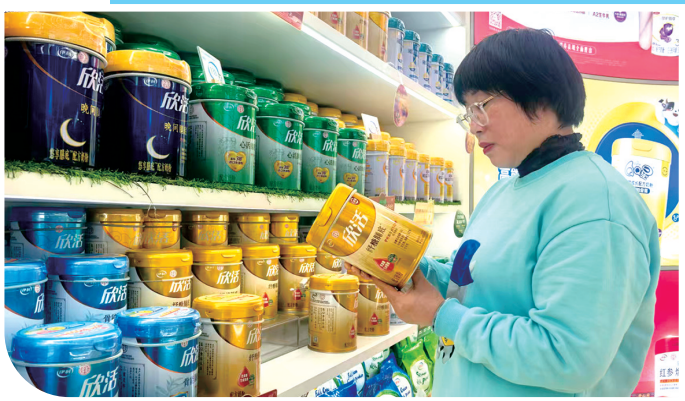
消费者选购欣活奶粉。

从药材筛选到牧场奶源,从古法配伍到现代工艺,全链路可追溯让消费者“吃得放心”有了具体依托。