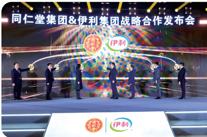
伊利与同仁堂达成战略合作。

业内人士认为,与同仁堂的跨界合作是伊利以“药食同源”为理念打开功能性赛道新空间的大胆尝试,更体现了伊利在“药食同源”领域的深度布局和长远规划,预示着中国乳制品产业与中医药领域的跨界融合将迈入新的发展阶段,为健康食品行业带来机遇。