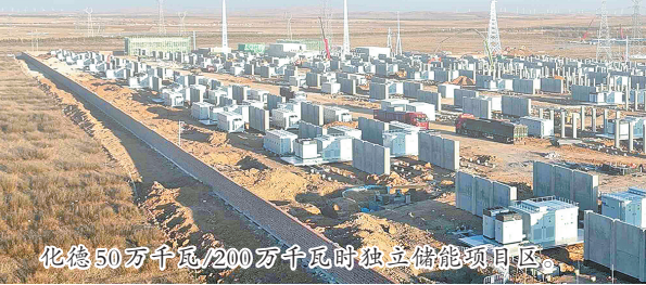
化德50万千瓦、200万千瓦时独立储能项目区。