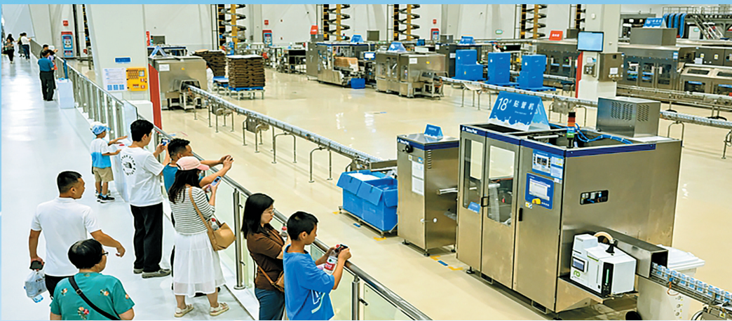
游客在伊利现代智慧健康谷参观游览。