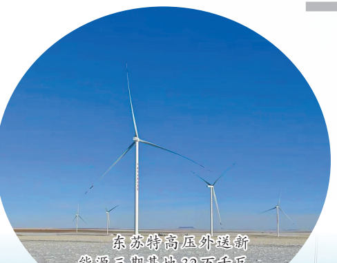
东苏特高压外送新能源三期基地32万千瓦风储项目区。