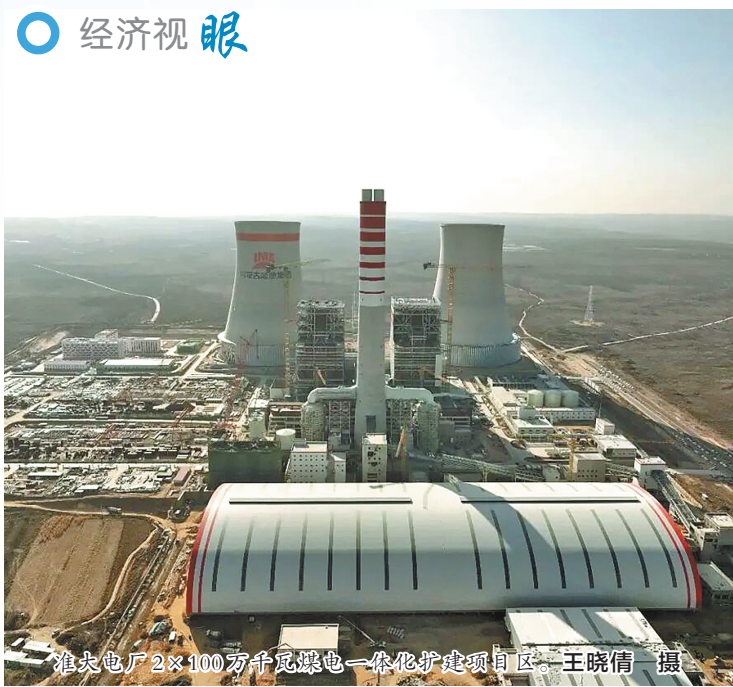
准东电厂2x100万千瓦煤电一体化扩建项目区。