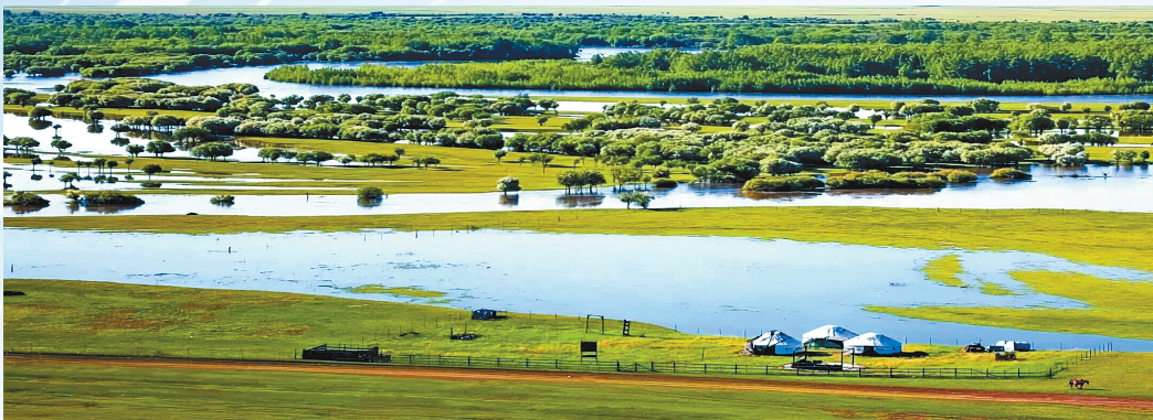
盛夏时节美丽如画的呼伦贝尔大草原。