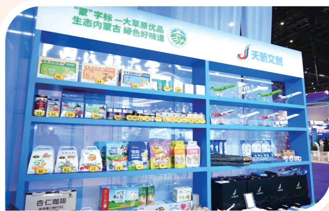
天骄航空“以航助农”让大草原优品乘机远航。