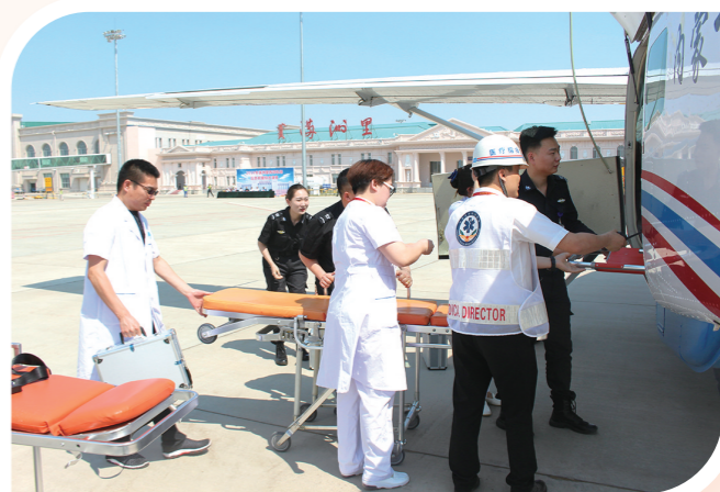
内蒙古通用航空公司在实施医疗救援。

站在“十五五”新起点,内蒙古交通投资集团将继续写意蓝天,为这片充满希望的土地,铺展一条更加畅通、更具活力、更富温度的发展天路,在内蒙古综合立体交通网络建设中勇担使命、锐意进取,以更高水平的航空服务、更完善的低空经济体系、更智慧的交通解决方案,连接城乡、融通产业、造福人民,以“干支通低”全要素的航空产业发展成果,推动内蒙古连通全国、走向世界,实现低空经济覆盖农村牧区、走进最小单元,为内蒙古经济社会高质量发展和满足人民日益增长的美好生活需要注入源源不断的航空动能。