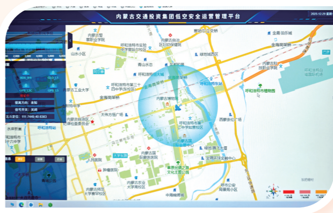
低空安全运营管理平台。