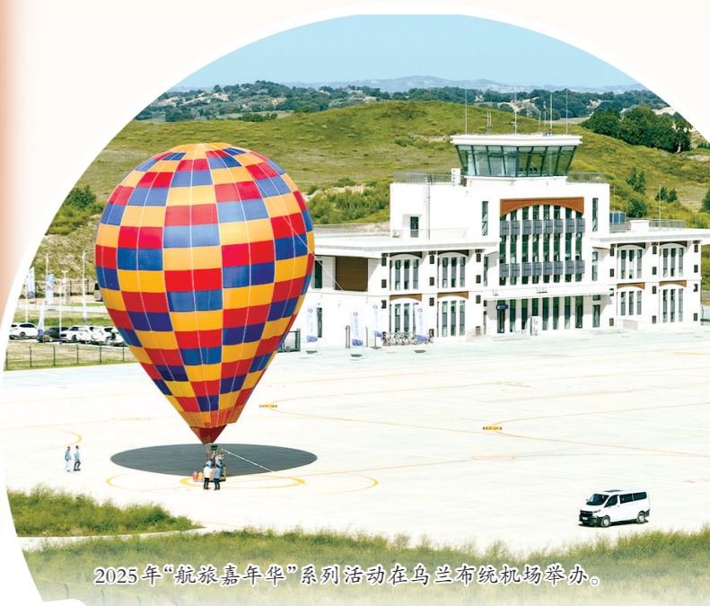
2025年“航旅嘉年华”系列活动在乌兰布统机场举办。