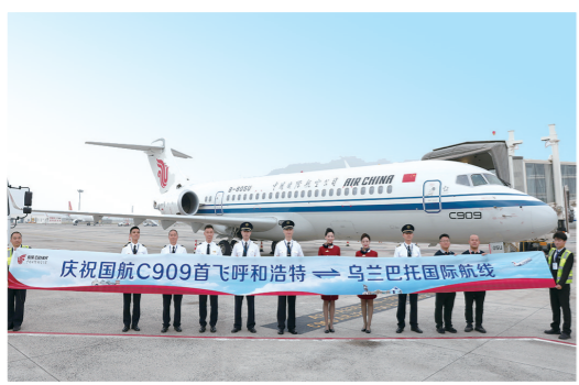
庆祝国航C909首飞呼和浩特—乌兰巴托国际航线。

完善的“干支通低”航空发展格局,不仅夯实了内蒙古交通投资集团航空板块高质量发展的基础,更打通了交融融合与区域通达的新通道,让草原美景走向全国,让新鲜农畜产品快捷出区。随着航线网络持续优化、通航服务不断拓展,内蒙古交通投资集团正以“飞”的速度,为内蒙古连接世界、振兴产业、惠及民生、安全发展等搭建高品质的空中通道。