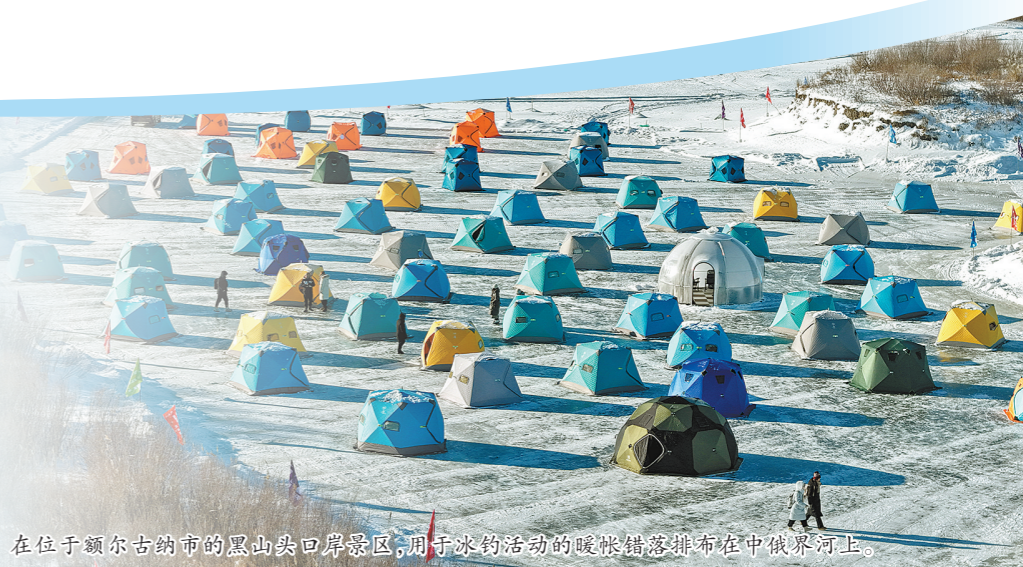
在位于额尔古纳市的黑山头口岸景区,用于冰钓活动的暖帐错落排布在中俄界河上。