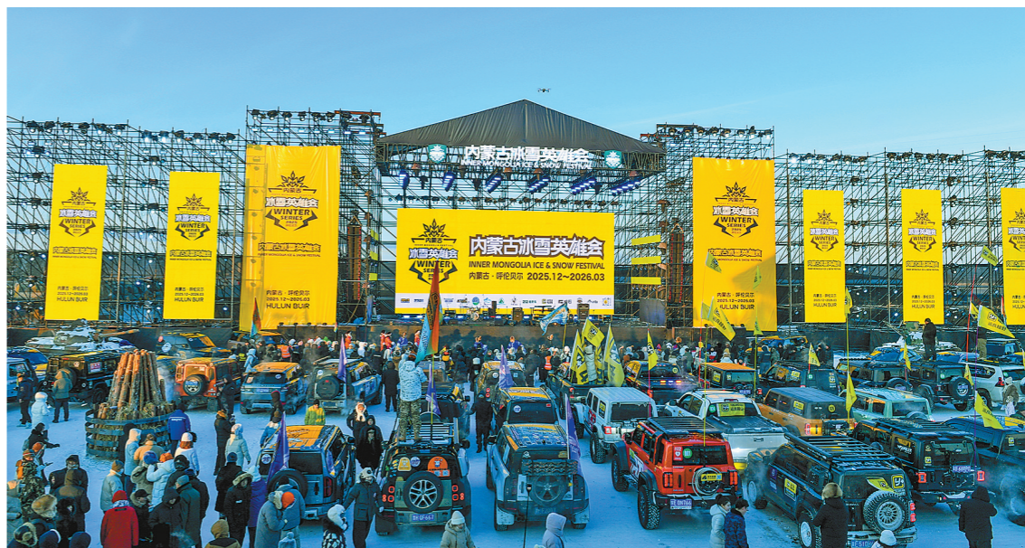
内蒙古冰雪英雄会开幕式现场。