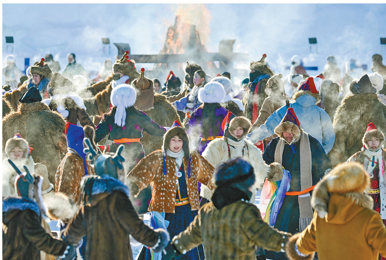
第二十一届内蒙古自治区冰雪那达慕开幕式上,群众载歌载舞。