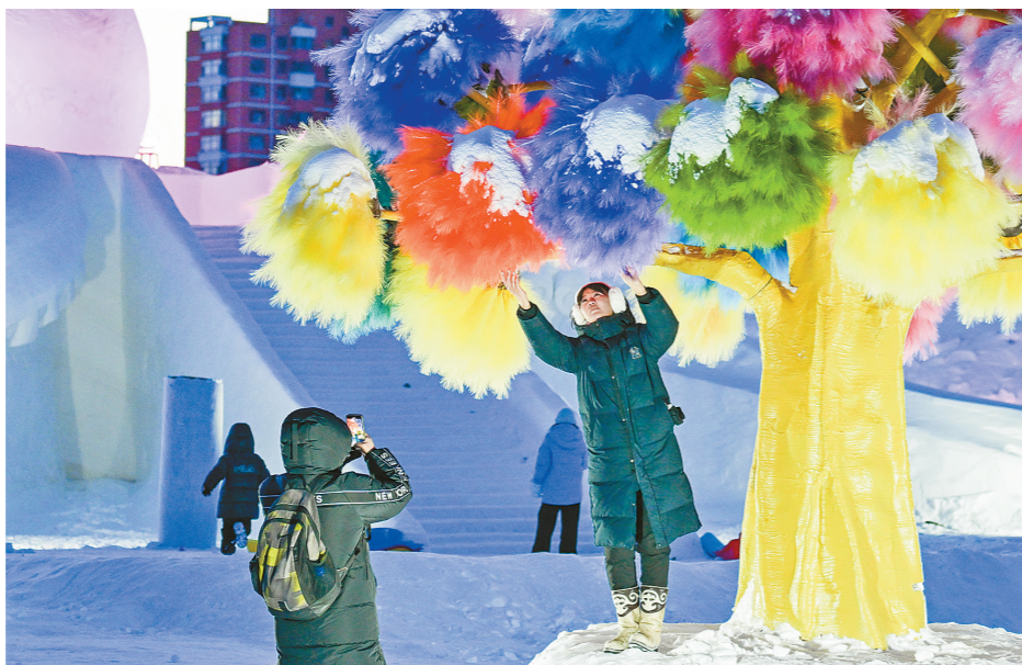
游客在呼伦贝尔“绒绒雪世界”打卡拍照。