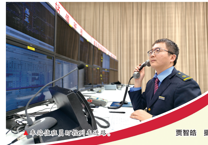
▲车站值班员盯控列车进路。