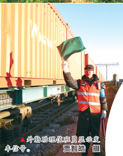
▲外勤助理值班员显示发车信号。

“十四五”期间,铁路部门持续推进口岸基础设施互联互通水平,及时打通堵点难点,截至2025年12月29日,累计完成进出口运量8229.97万吨、接运出入境中欧班列15905列,为地方经济社会发展贡献了力量。