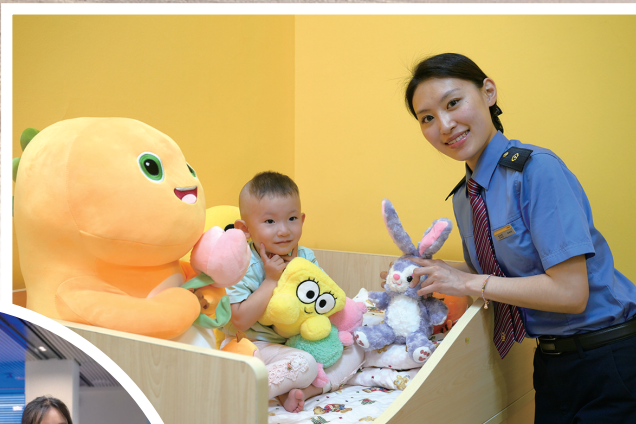
▲包头站客运员在母婴室内照看儿童旅客。