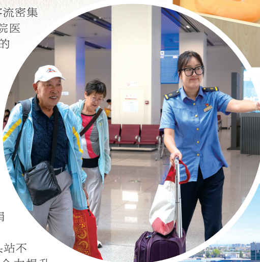
▲包头站客运员协助老年旅客在站内换乘。