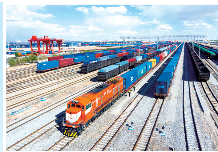
▲中欧班列在二连浩特铁路口岸准轨场整装待发。