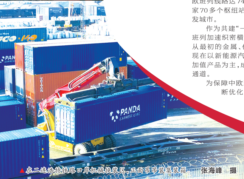
▲在二连浩特铁路口岸机械换装区,正面吊吊装集装箱。