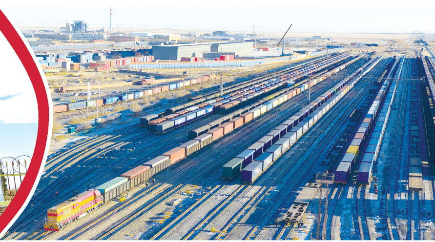
▲编组中欧班列。