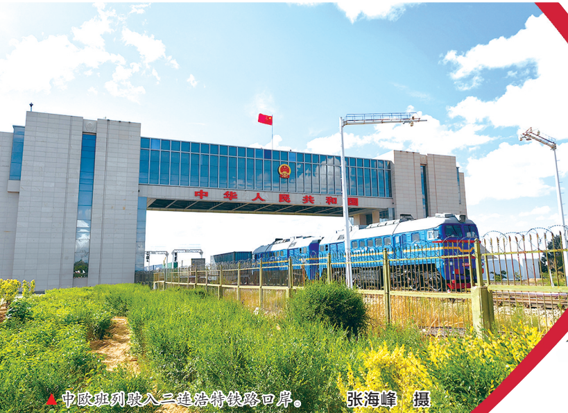
▲中欧班列驶入二连浩特铁路口岸。