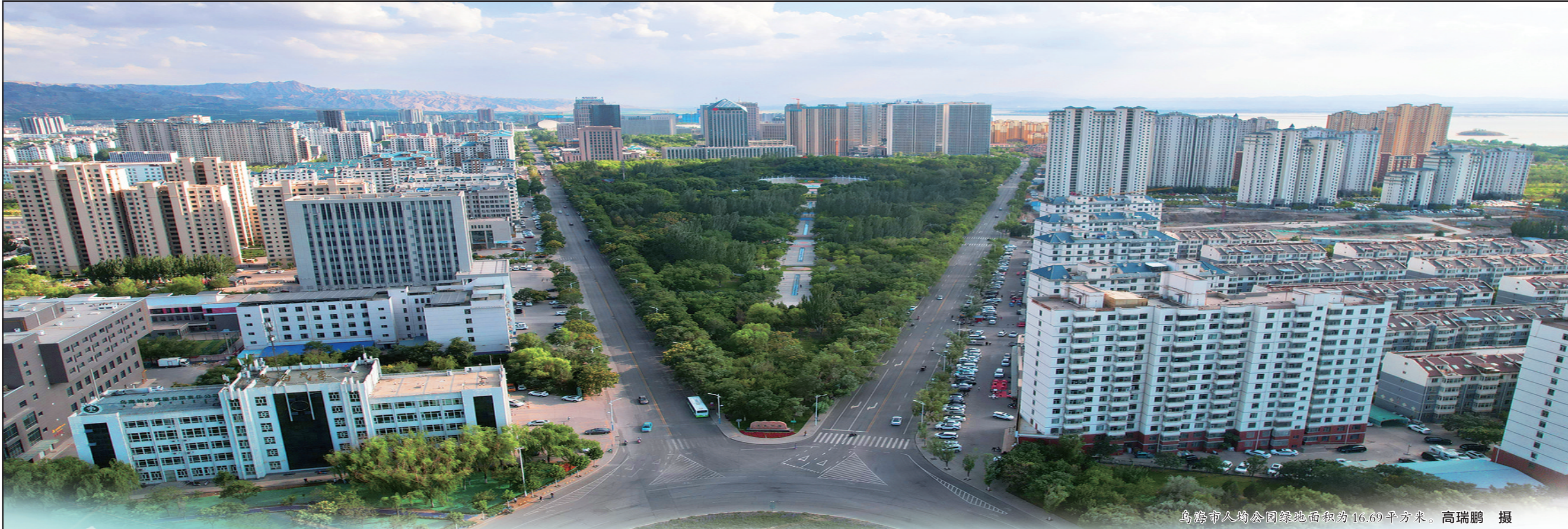
乌海市人均公园绿地面积为16.69平方米。