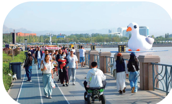
游客漫步于乌海湖畔,感受这座城市的秀丽风景。