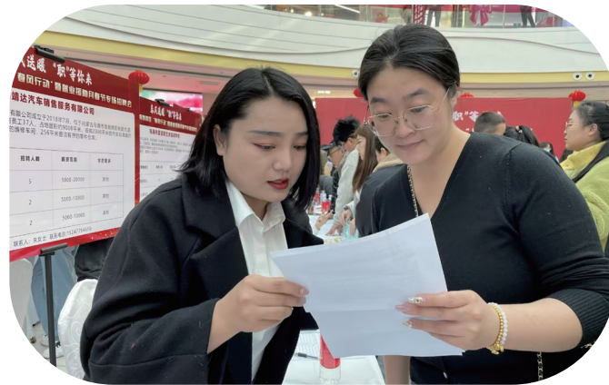
求职者在就业招聘会上寻找职位。

民之所盼,政之所向。展望新征程,乌海市将持续聚焦人民对美好生活的向往,坚持尽力而为、量力而行,加强普惠性、基础性、兜底性民生建设,切实解决好人民群众急难愁盼问题,稳步推进基本公共服务均等化,建设更高水平平安乌海,让发展成果更多更公平惠及各族人民。