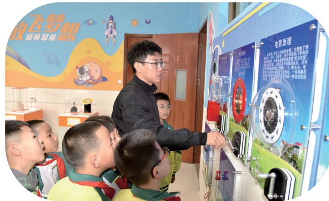
海南区第四小学的学生在上科学实验课。