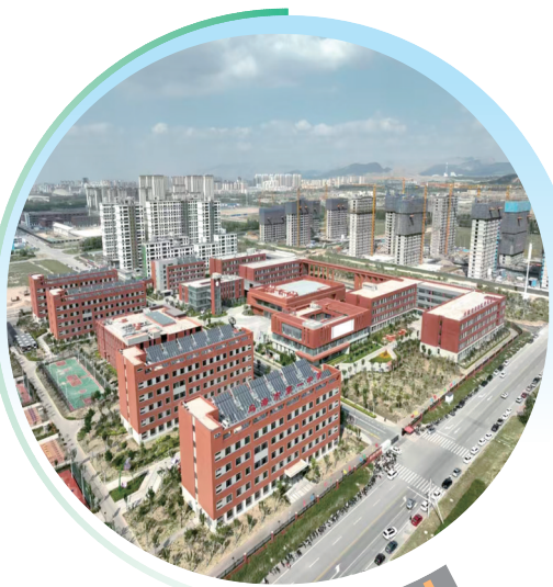
乌海市第一中学新校区。