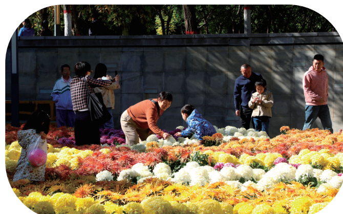
公园里的菊花展吸引市民观赏。