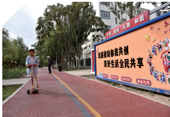
新建的“口袋公园”加码群众幸福生活。