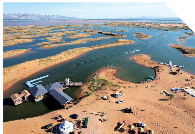
乌海湖西岸。