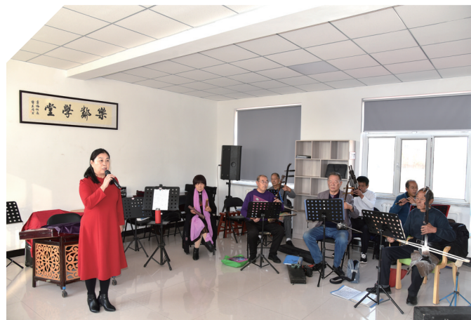
社区群众在乌达区景泰小区开展文化活动

5年来,乌海市坚持依法治理民族事务,进一步夯实中华民族共同体的法治基础。坚持把民族事务治理作为城市社会治理的重要组成部分一体推进,制定《关于进一步加强社区民族工作的意见》。打造“普法早市”“法治乌兰牧骑”等普法品牌,推动党的民族政策和法律法规融入群众生活。创新构建“流动办公桌”“初心会客厅”“和乐亭”等社情民意沟通平台,深入开展“民族团结一家亲”结亲活动,1022个党组织、1836名党员干部与2095户群众结成帮扶对子,累计帮助解决生产生活困难751件,听取工作意见建议404条,密切党群干群关系,凝聚了民族团结发展合力。