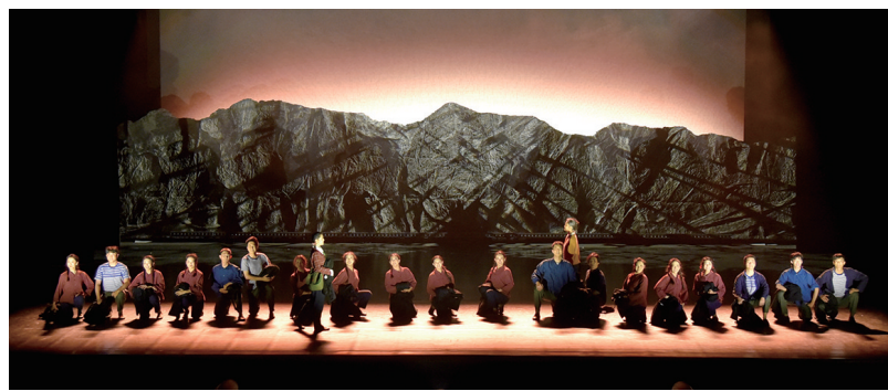
乌海市重点打造的文艺精品剧目《三线印记》震撼上演。