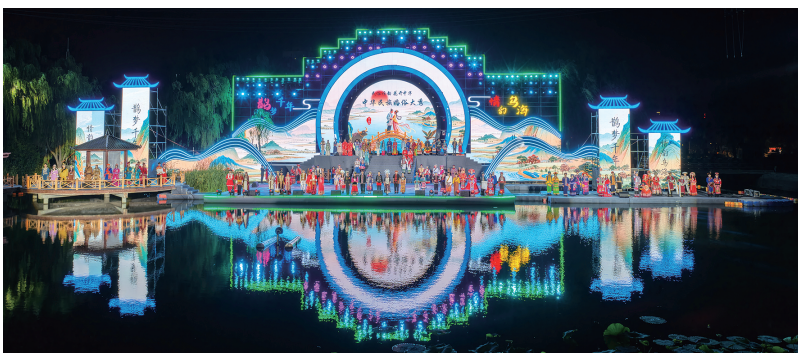
2025年,乌海市在“七夕”活动中举办中华民族婚俗文化大秀。