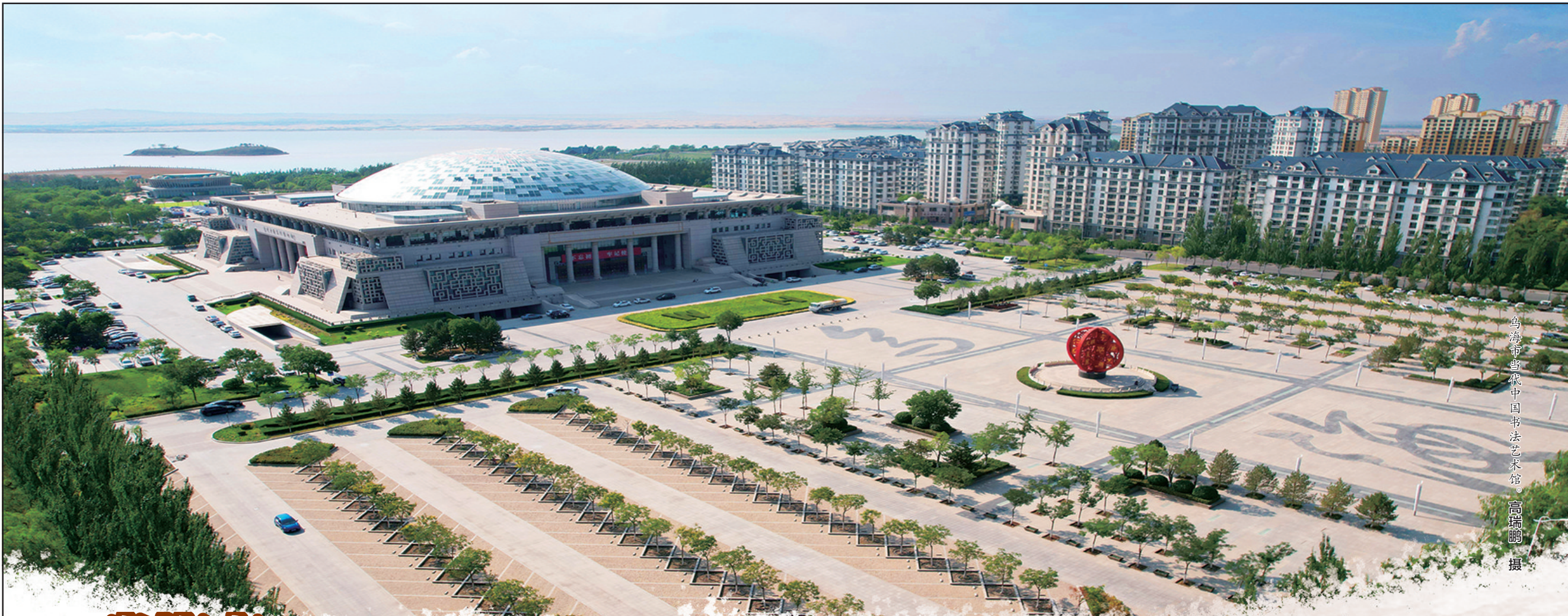
乌海市当代中国书法艺术馆