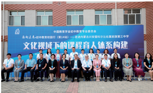
面向未来 初中教育校园行(第14站)——走进科右前旗第三中学。

据统计,2017年以来,兴安盟通过京蒙协作渠道累计销售农产品达70.52亿元,其中兴安盟大米进京销售7.3万吨,销售额10亿元,成功探索出“好米变名米、名米卖好价”的产业升级路径。2025年累计举办各类“兴安好物进北京”推广活动79场,覆盖北京123个街道社区,实现销售额1.13亿元。通过建立苏木乡镇与北京镇街的结对销售机制,大米、牛羊肉等特色农产品源源不断进入首都市场。