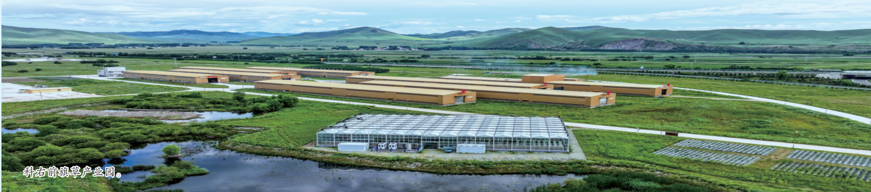
科右前旗草原产业园。