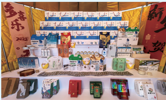
兴安盟大米系列产品。