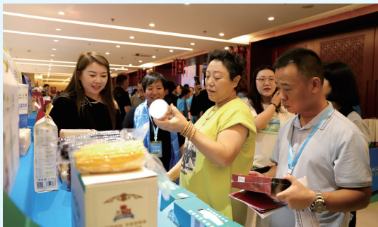
北京市民了解兴安盟产品。