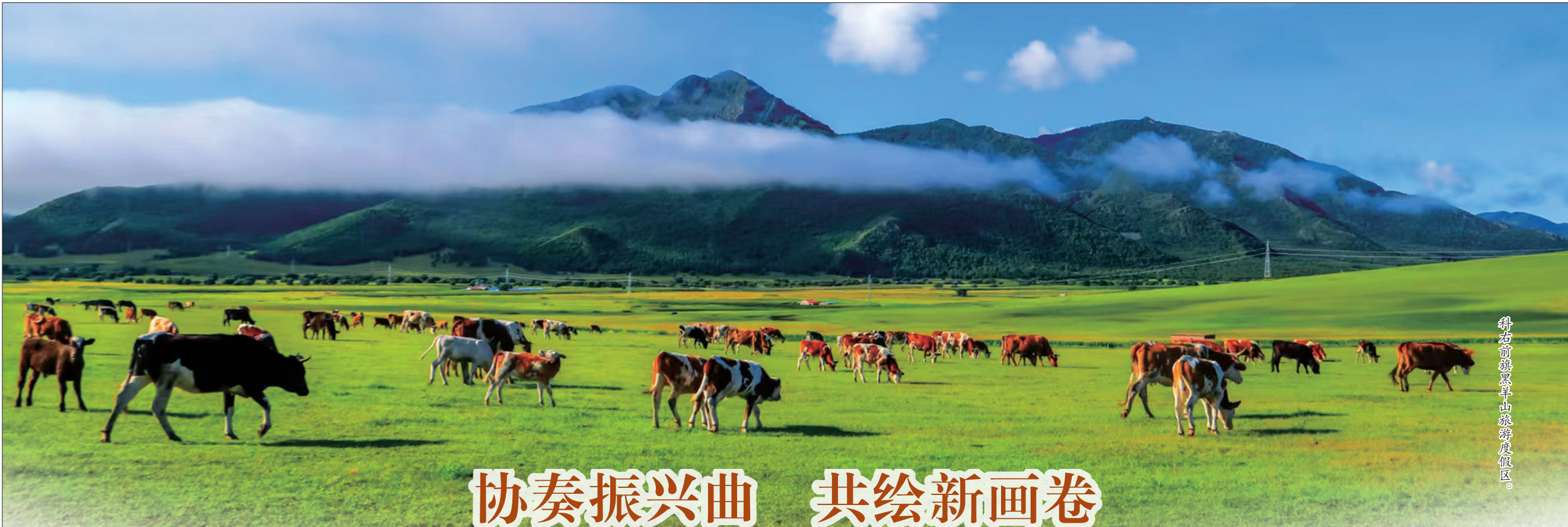
科右前旗草原山泉度假区。