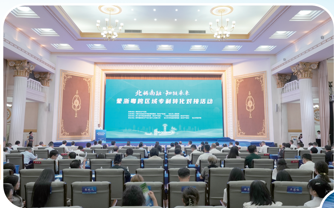
成功举办蒙浙粤跨区域专利转化对接活动。