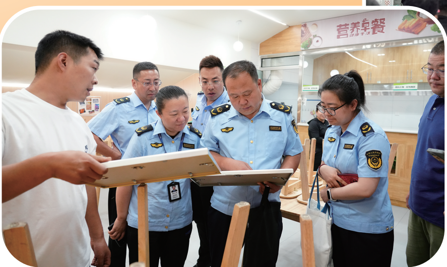
开学季,市场监管执法人员对校园周边食品安全进行检查。