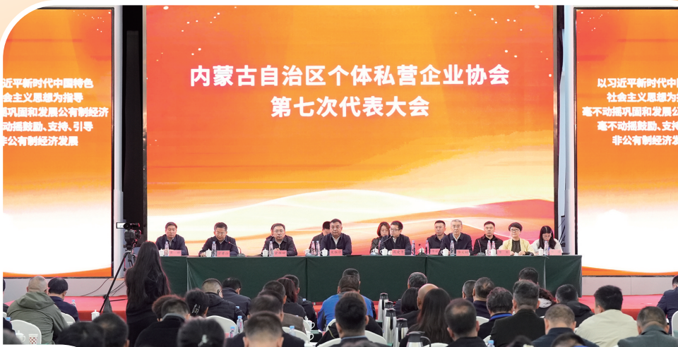
内蒙古自治区个体私营企业协会召开第七次代表大会。

绘制“一体化”作战蓝图,印发《食品安全“雷霆行动”实施方案》,围绕“五大专项整治+三项提升行动”明确工作任务、责任科室及时间节点,相关业务科室分别制定了细化落实举措,各县市区同步跟进落实,形成“市级统筹、县县落实、多级联动”的工作格局。 打造“精准化”监管体系。围绕食品生产经营主体责任落实、食品添加物使用、集体用餐风险管控等十大关键环节开展拉网式排查,建立风险隐患排查、实行销号管理,做到排查全覆盖、隐患无死角。全市共排查食品生产经营主体4.6万家,发现风险隐患4274个,全部整改到位。聚焦民生关切,肉类、食品添加剂“两超一非”五个领域的专项