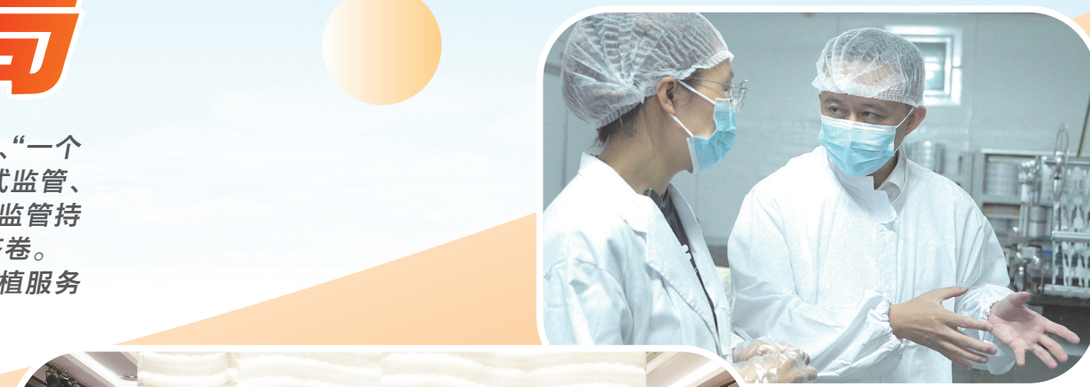
邀请国家市场监督管理总局专家深入企业开展质量帮扶。

破壁坚促服务,让营商沃土孕育蓬勃生机。企业开办全流程网办率超95%,帮助6.2万户经营主体重新申领“诚信身份证”,助力171户个体工商户转型升级为企业,指导46户个体工商户获评全国“名特优新”称号,5年内里市经营主体总量从14万户增至18.6万户,增长32.9%,企业占比从29:100提升至31:100。 严整治强监管,让市场环境更加清朗透明。“十四五”期间,累计审结行政处罚1102件,清理废除妨碍统一市场和公平竞争的政策措施161件,修改62件。严厉打击虚假宣