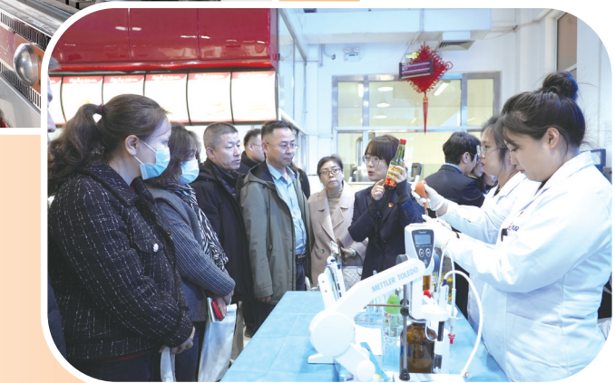
校园食品安全主题活动现场,检验检测工作人员进行科普讲解。