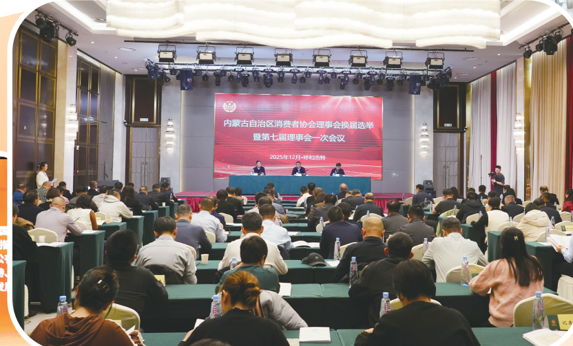
内蒙古自治区消费者协会召开理事会换届选举暨第七届理事会一次会议。