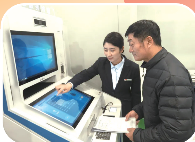
帮办代办人员帮助个体工商户通过智能终端办理营业执照。