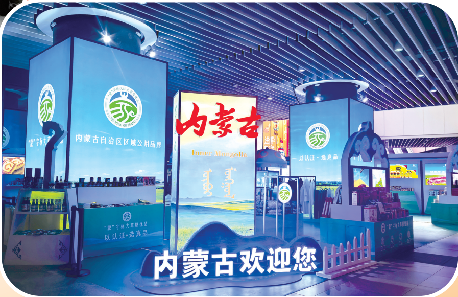
“蒙”字标大米原优品亮相第八届中国国际进口博览会。

2025年,全区市场监管系统以习近平新时代中国特色社会主义思想为指导,紧紧围绕建设“两个屏障”、“两个基地”、“一个桥头堡”战略定位,将铸牢中华民族共同体意识贯穿市场监管全过程、各方面,以改革开路、用创新破局,纵深推进“体检式监管、服务型执法”,营商环境持续优化、市场运行更加规范、市场循环有效畅通、质量支撑显著增强、知识产权加速赋能、安全监管持续加力,涌现出一批可复制、可推广的创新实践,持续激荡起“干就干成、干就干好”的奋进力量,圆满交出“十四五”收官答卷。 站在“十四五”开局起步关键节点,全区市场监管系统将锚定目标、坚定信心、真抓实干、勇毅前行,深耕监管为民、厚植服务底色,为奋力书写中国式现代化内蒙古新篇章贡献市场监管力量。