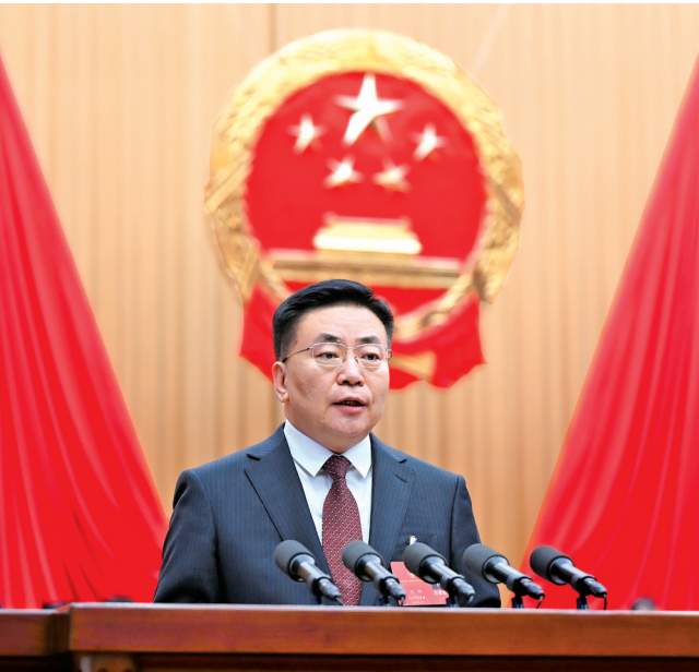
自治区人民政府主席包钢作政府工作报告。

各位代表: 现在,我代表自治区人民政府向大会报告工作,请予审议,并请各位政协委员和列席同志提出意见。