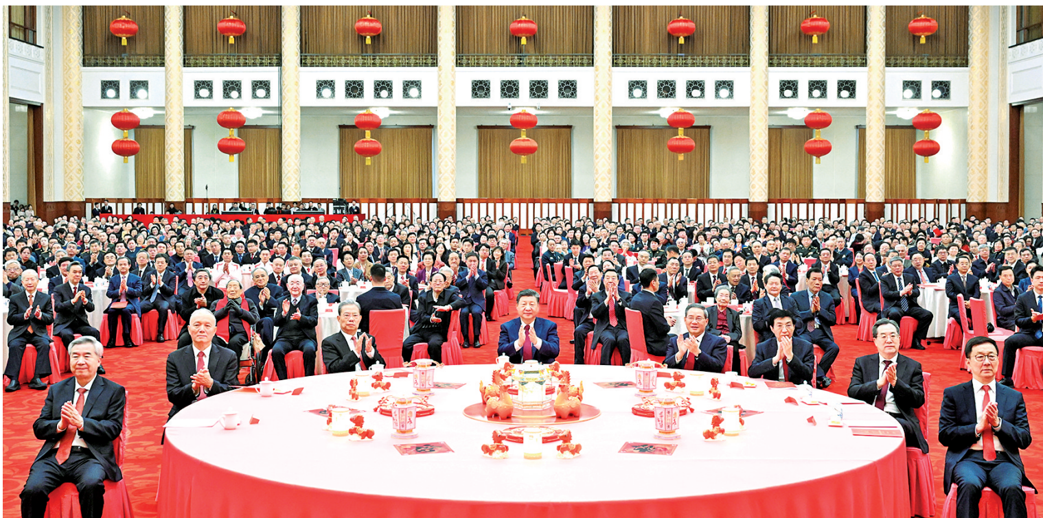
2月14日,中共中央、国务院在北京人民大会堂举行2026年春节团拜会。党和国家领导人习近平、李强、赵乐际、王沪宁、蔡奇、丁薛祥、李希、韩正等同首都各界人士欢聚一堂、共迎佳节。