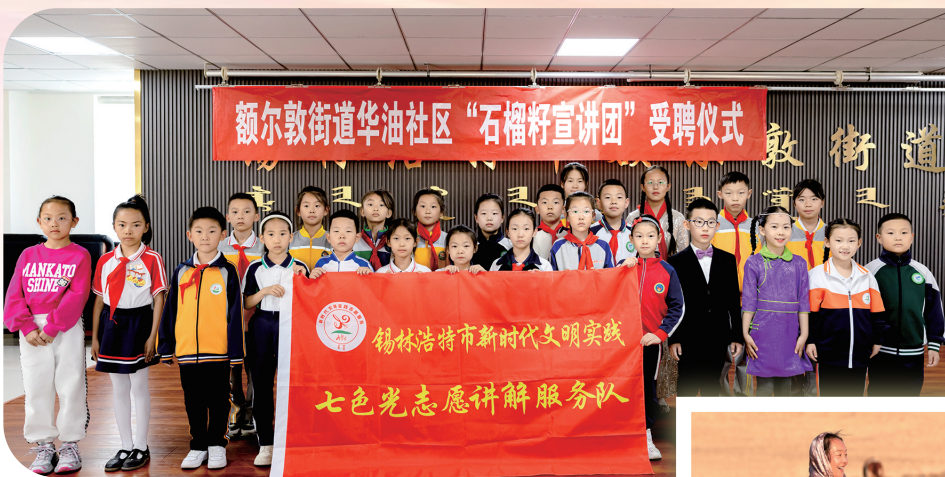
锡林浩特市额尔敦街道聘任辖区中小学生对“红石榴”宣讲员。