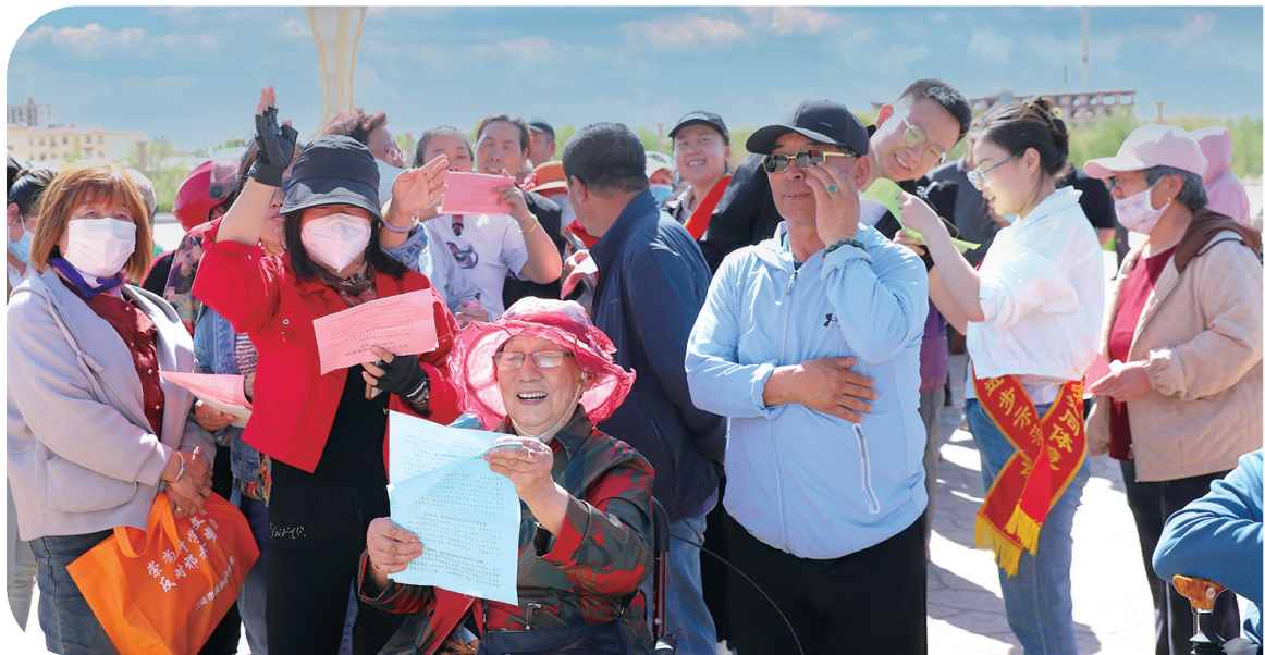
“民族政策宣传月”活动在二连浩特市恐龙广场举行,参加启动仪式活动的各族群众踊跃参加有奖问答。

锡林郭勒盟自2022年5月启动创建全国民族团结进步示范盟工作以来,始终坚持以铸牢中华民族共同体意识为主线,坚持创建依靠人民、创建成果惠及人民,紧紧围绕“一廊一带四个基地”创建工作载体,生动擦亮“牢记嘱托共奋进 石榴花开映锡林”创建品牌,该盟民族团结进步、经济高质量发展、人民安居乐业、社会和谐稳定的大好局面不断巩固。同时,在创建过程中,实践形成了一批符合实际、创新高效的经验做法。