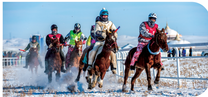
冬季马超比赛上,参赛选手们策马迎新春。