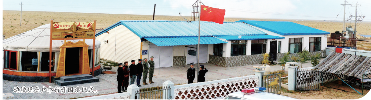
边境派出所举行升旗仪式。

下一步,锡林郭勒盟将认真贯彻落实自治区党委“1571”工作部署,构建“制度保障+思想铸魂+全域创建”的立体格局,持续擦亮“牢记嘱托共奋进 石榴花开映锡林”创建品牌,在“一廊一带四个基地”的基础上,打造锡林郭勒盟供电公司在内的“一廊一带五个基地”,力争在“十五五”期间,创建更多的国家级民族团结进步示范区示范单位,进一步将锡林郭勒盟打造成为新时代民族团结进步的亮丽风景线。