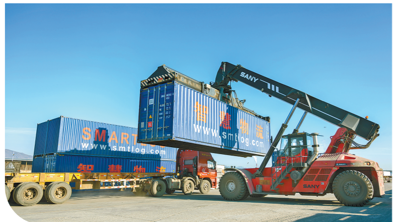
在呼和浩特物流园台阁牧站,车辆正在进行集装箱装卸作业。