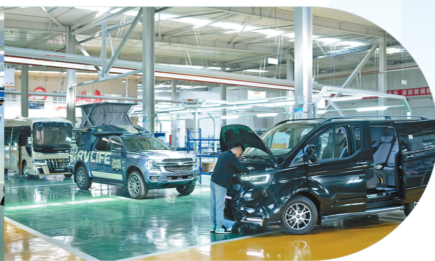
呼和浩特综合保税区内,汽车改装出口企业工作人员正在调试车辆。

春风浩荡,开放潮涌。随着《中国(内蒙古)自由贸易试验区总体方案》正式印发,中国(内蒙古)自由贸易试验区顺利揭牌,我国第23个自由贸易试验区落地内蒙古。此次自由贸易试验区的设立,填补了我国北部沿边地区自由贸易试验区布局空白,进一步完善国家对外开放格局。坐拥4200多公里边境线、20个对外开放口岸的内蒙古,迈上高水平对外开放新台阶,推动我国向北开放重要桥头堡建设进入崭新阶段。