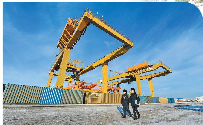
满洲里海关所属满洲里车站海关关员在满洲里新集装箱场对中欧班列集装箱进行巡检。