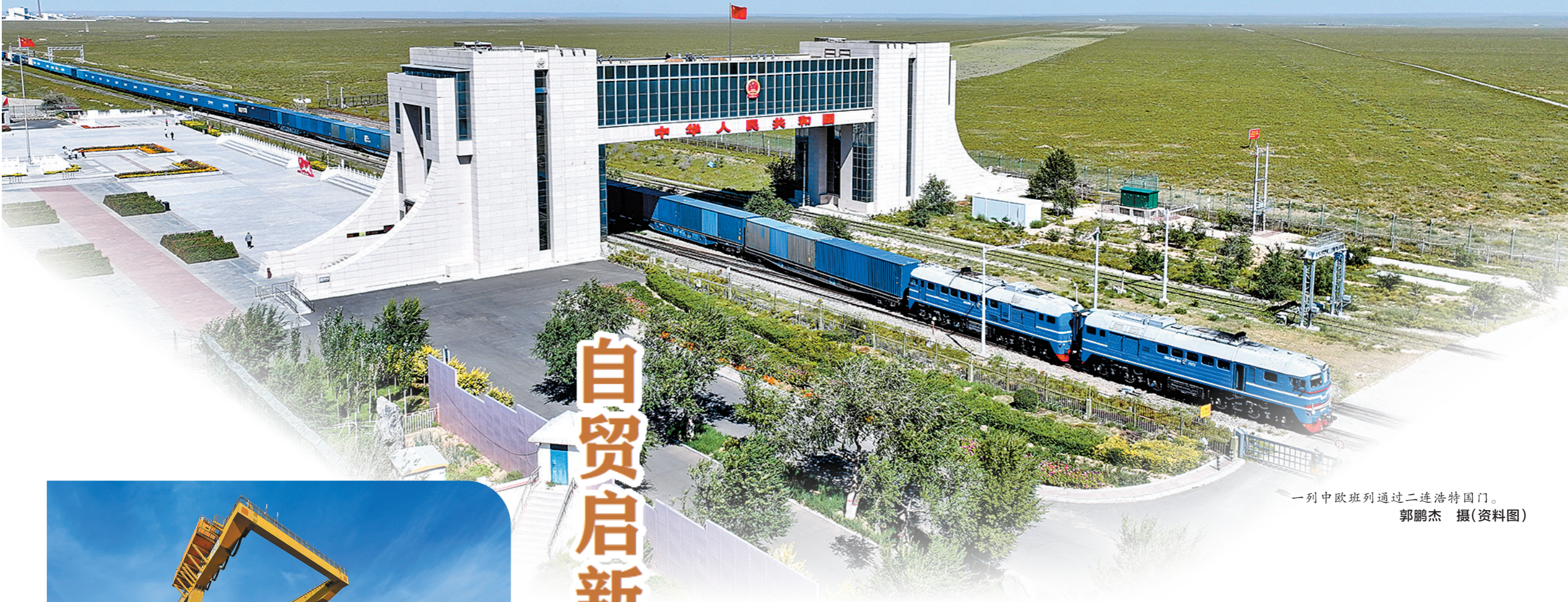
—列中欧班列通过二连浩特国门。(资料图)