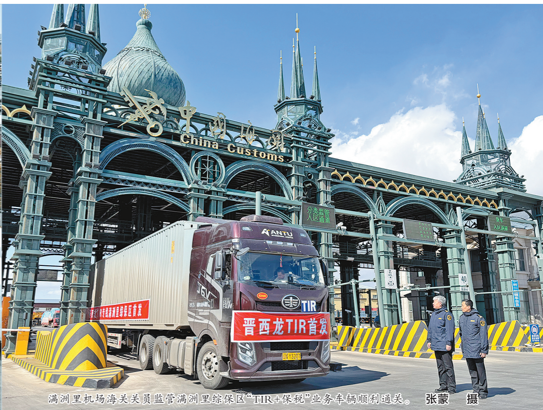
满洲里机场海关关员监管满洲里综保区“TIR+保税”业务车辆顺利通关。