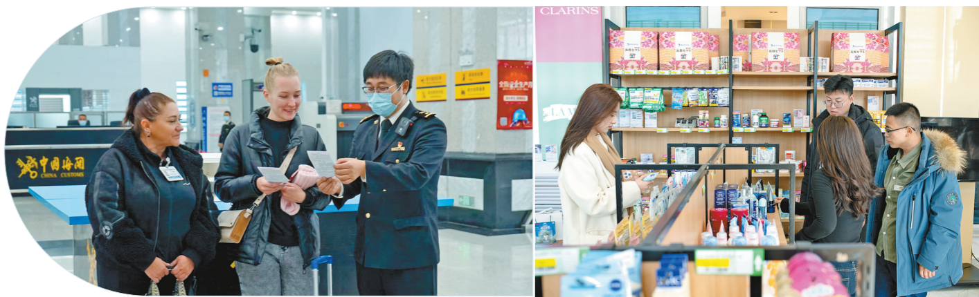
满洲里海关所属满洲里十八里海关关员优化通关服务,保障进出境旅客顺畅通关。