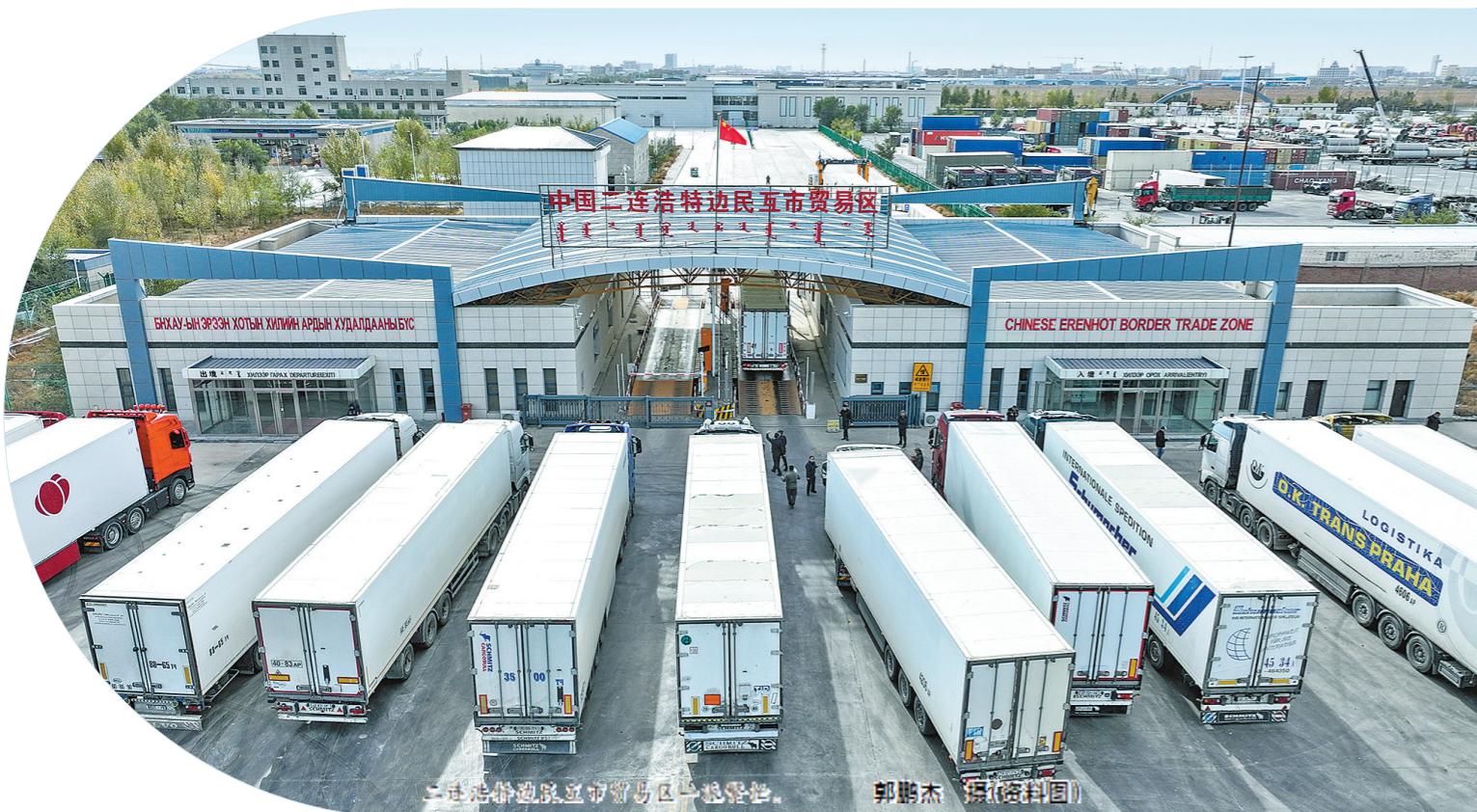
二连浩特国际互市贸易区一片繁忙。 郭鹏杰 摄(资料图)

以自由贸易试验区建设为新起点,内蒙古正以更加开放的姿态,持续提升我国向北开放重要桥头堡功能,在服务国家对外开放大局中展现新担当、实现新作为。