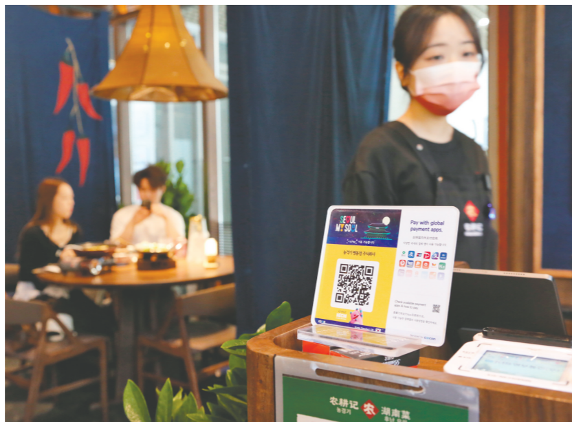
4月24日，韩国首都首尔的一家餐厅展示支持微信支付的二维码。

微信支付相关负责人介绍，在韩国，从地铁购票、咖啡馆点单，到免税店购物、夜市消费，扫码支付成为中国游客“新常态”。数据显示，今年春节期间，在微信支付境外线下交易数量排名中，韩国进入前五。今年2月15日至20日，中国游客在韩国当地消费金额