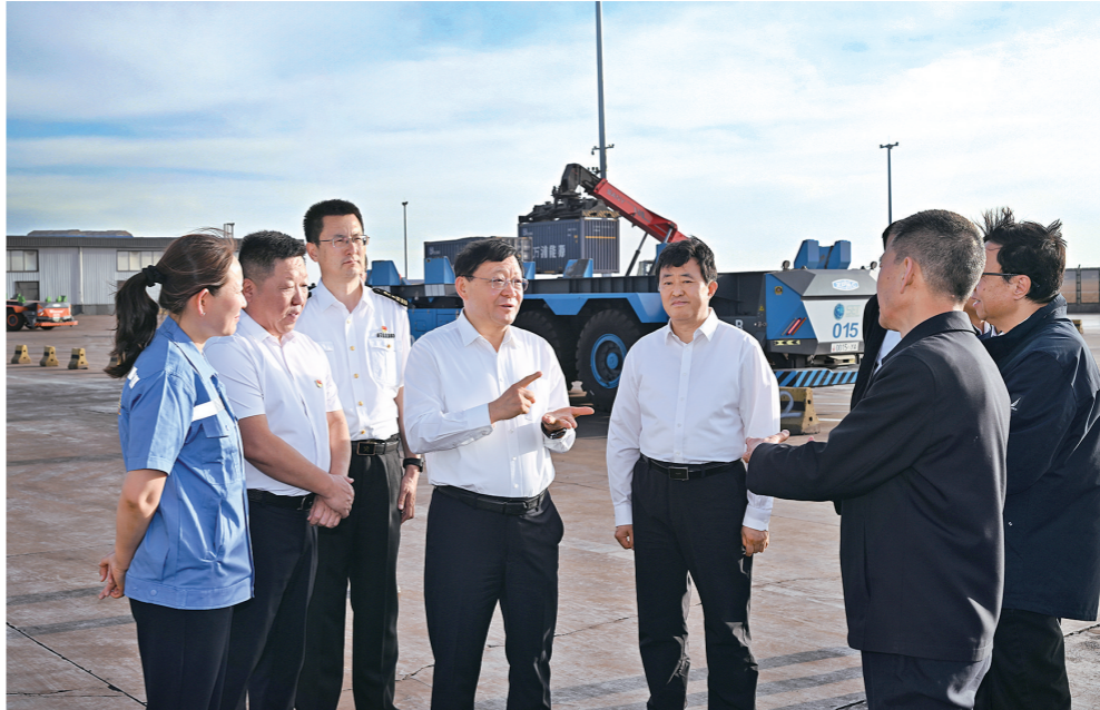
5月11日,自治区党委书记、人大常委会主任王伟中在甘其毛都口岸实地考察察汗中慧AGV(自动导引车)海关监管场所,了解无人驾驶跨境运输情况。

本报5月12日讯 (记者 李晗)5月11日至12日,自治区党委书记、人大常委会主任王伟中深入巴彦淖尔市调研,强调要深入贯彻习近平总书记对内蒙古系列重要讲话精神,牢固树立和践行正确政绩观,扎实推进高质量发展,着力整治群众身边不正之风和腐败问题,加强和改进信访工作,推动自治区党委“1571”工作部署不断走深走实。 乌拉特中旗“金石交”融创品牌街项目深入挖掘各民族共有共享的中华文化符号,构建起富有特色的民族手工业产业链。王伟中与非遗传承人、手工艺人、商铺店主亲切交谈,详细了解民族手工业创意设计、材料来源、品牌创建、线上线下销售等情况,鼓励大家深入挖掘我区丰富的历史文化资源,创新传承中华优秀传统文化,与时俱进推进产品和营销模式升级。他要求有关方面加大对民族手工业品制作等文化产业发展的支持力度,更好促进各民族交往交流交融和群众就业增收,推进中华民族共同体建设。