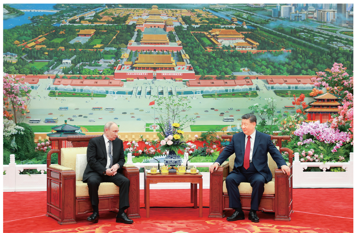
五月二十日晚,国家主席习近平在北京人民大会堂同俄罗斯总统普京举行茶叙。