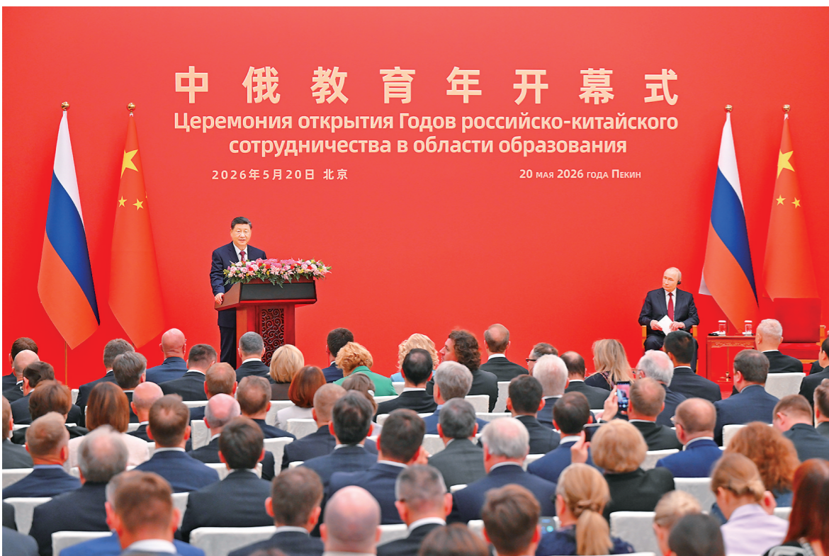
五月二十日下午,国家主席习近平同俄罗斯总统普京在北京人民大会堂共同出席“中俄教育年”开幕式。