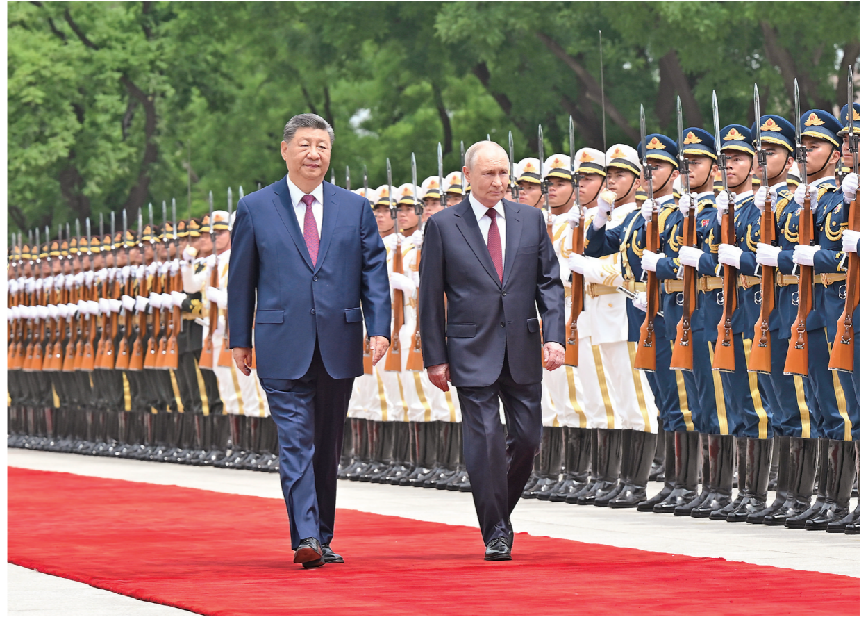
5月20日上午,国家主席习近平在北京人民大会堂同来华进行国事访问的俄罗斯总统普京举行会谈。会谈前,习近平在人民大会堂东门外广场为普京举行欢迎仪式。

新华社北京5月20日电 (记者 杨依军 温馨)5月20日上午,国家主席习近平在北京人民大会堂同来华进行国事访问的俄罗斯总统普京举行会谈。两国元首一致同意《中俄睦邻友好合作条约》继续延期。 两国元首先后举行小范围、大范围会谈。 习近平指出,今年是中俄战略协作伙伴关系建立30周年和《中俄睦邻友好合作条约》签署25周年。中俄两国签署睦邻友好合作条约,以法律形式确立了长期睦邻友好、全面战略协作的制度基础,中俄关系由此实现跨越式发展。中俄关系一步一个脚印走到今天这个高度,是因为双方以“千磨万击还坚劲”的毅力不断深化政治互信和战略协作,以“更上一层楼”的精神拓展各领域合作,以“乱云飞渡仍从容”的勇毅捍卫国际公道正义、推动构建人类命运共同体。当前国际形势下,作为联合国安理会常任理事国和世界重要大国,中俄两国要着眼战略长远,以更高质量的全面战略协作助力各自国家发展振兴,推动构建更加公正合理的全球治理体系。 习近平指出,中俄两国坚持在平等相待、相互尊重、重信守义、合作共赢的基础上发展新时代全面战略协作伙伴关系,政治互信不断深化,经贸、投资、能源、科技、人文、地方等合作持续推进,民心相通更加牢固。中俄关系进入更有作为、更快发展的新阶段。坚定不移推动中俄关系长期、健康、稳定、高质量发展,是双方着眼两国根本利益和世界发展大势作出的战略选择。两国各部门要全力落实好我和普京总统达成的重要共识,充分把握历史机遇,推动两国的互信根基越扎越牢、合作成色越来越足、友谊之路越走越宽。 习近平强调,双方要聚焦两国发展振兴目标,充分发挥中俄合作机制全面、完备的特点,加强对全方位合