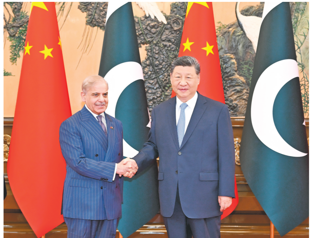
5月25日下午,国家主席习近平在北京人民大会堂会见来华进行正式访问的巴基斯坦总理夏巴兹。