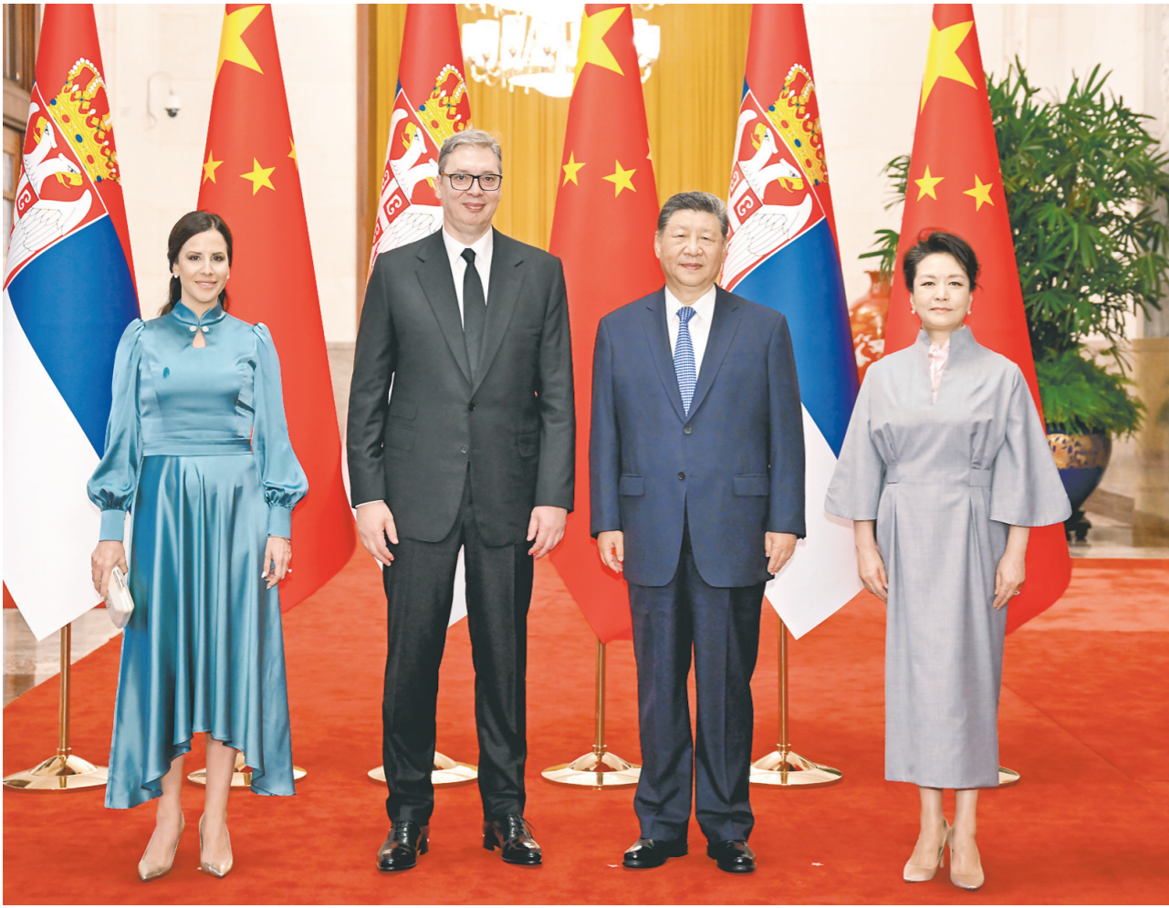
5月25日下午,国家主席习近平在北京人民大会堂同来华进行国事访问的塞尔维亚总统武契奇举行会谈。这是会谈前,习近平和夫人彭丽媛同武契奇和夫人塔玛拉合影。

新华社北京5月25日电 (记者 杨依军)5月25日下午,国家主席习近平在北京人民大会堂同来华进行国事访问的塞尔维亚总统武契奇举行会谈。