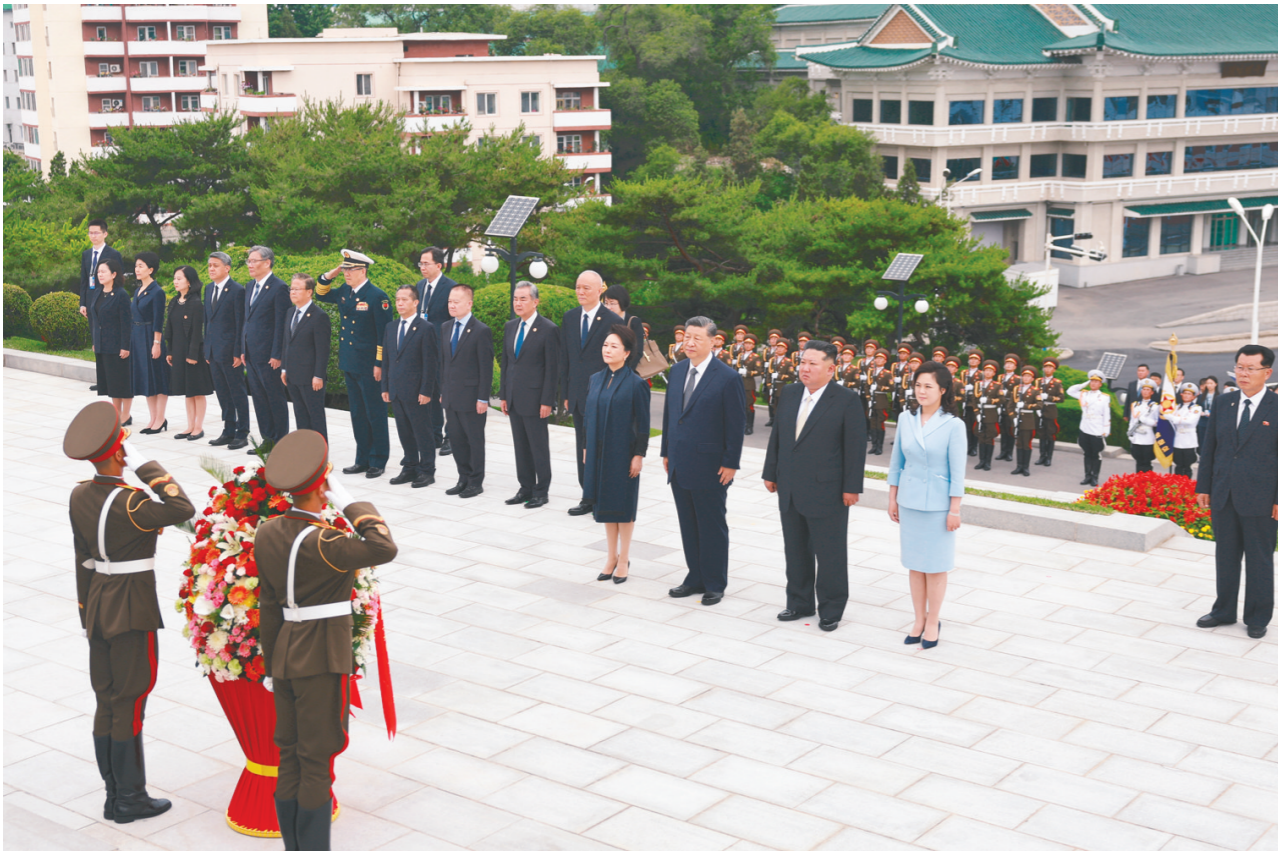
当地时间6月9日上午,正在朝鲜进行国事访问的中共中央总书记、国家主席习近平和夫人彭丽媛参谒中朝友谊塔。朝鲜劳动党总书记、国务委员长金正恩和夫人李雪主陪同。

新华社平壤6月9日电 (记者李忠发 朱基钗)当地时间6月9日上午,正在朝鲜进行国事访问的中共中央总书记、国家主席习近平和夫人彭丽媛参谒中朝友谊塔。朝鲜劳动党总书记、国务委员长金正恩和夫人李雪主陪同。