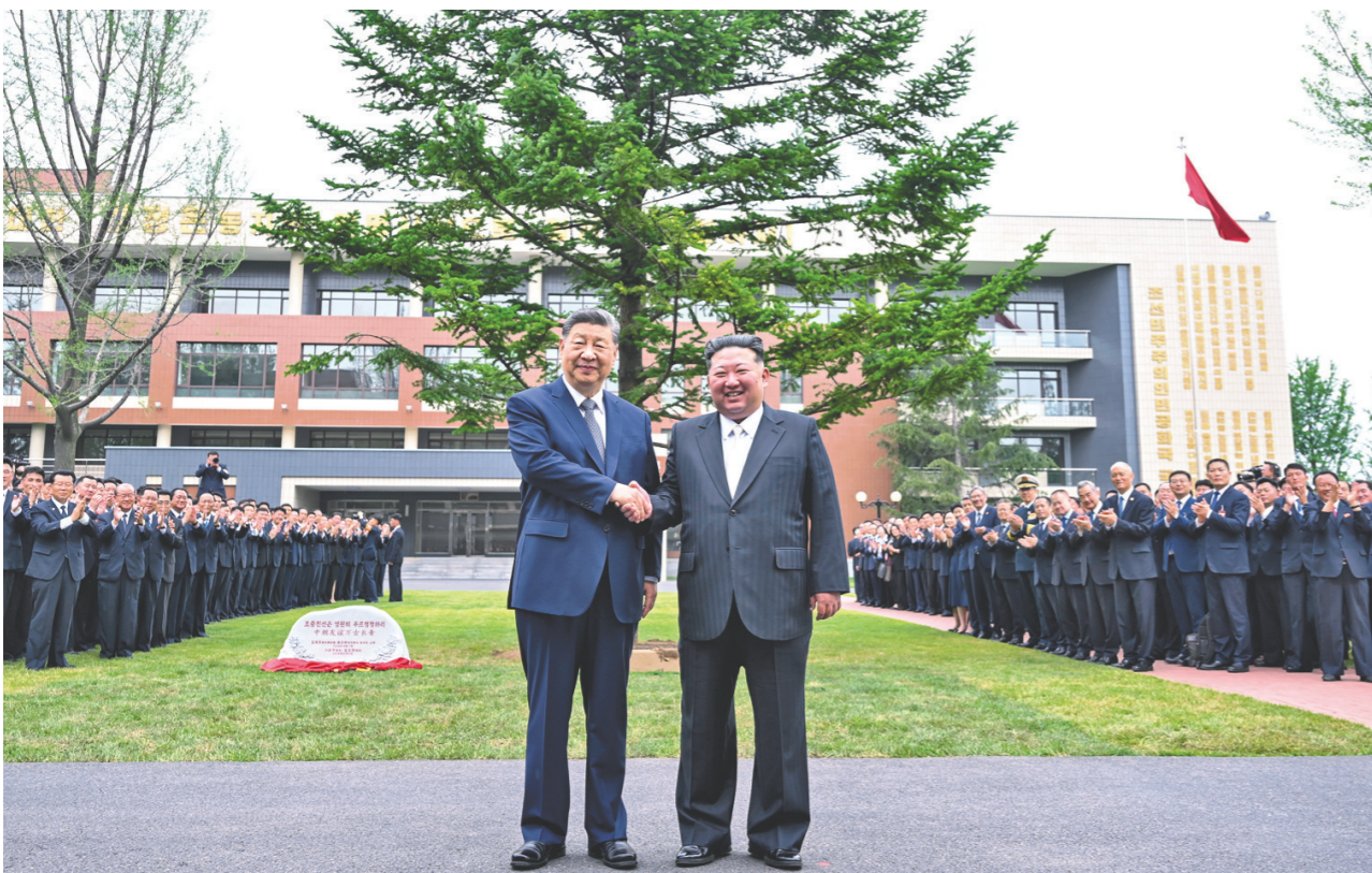
当地时间6月9日上午,中共中央总书记、国家主席习近平在朝鲜劳动党总书记、国务委员长金正恩陪同下,参访位于平壤的朝鲜劳动党中央干部学校。这是习近平和金正恩在教学楼之间的林地上共同种下一株枫树后握手合影。