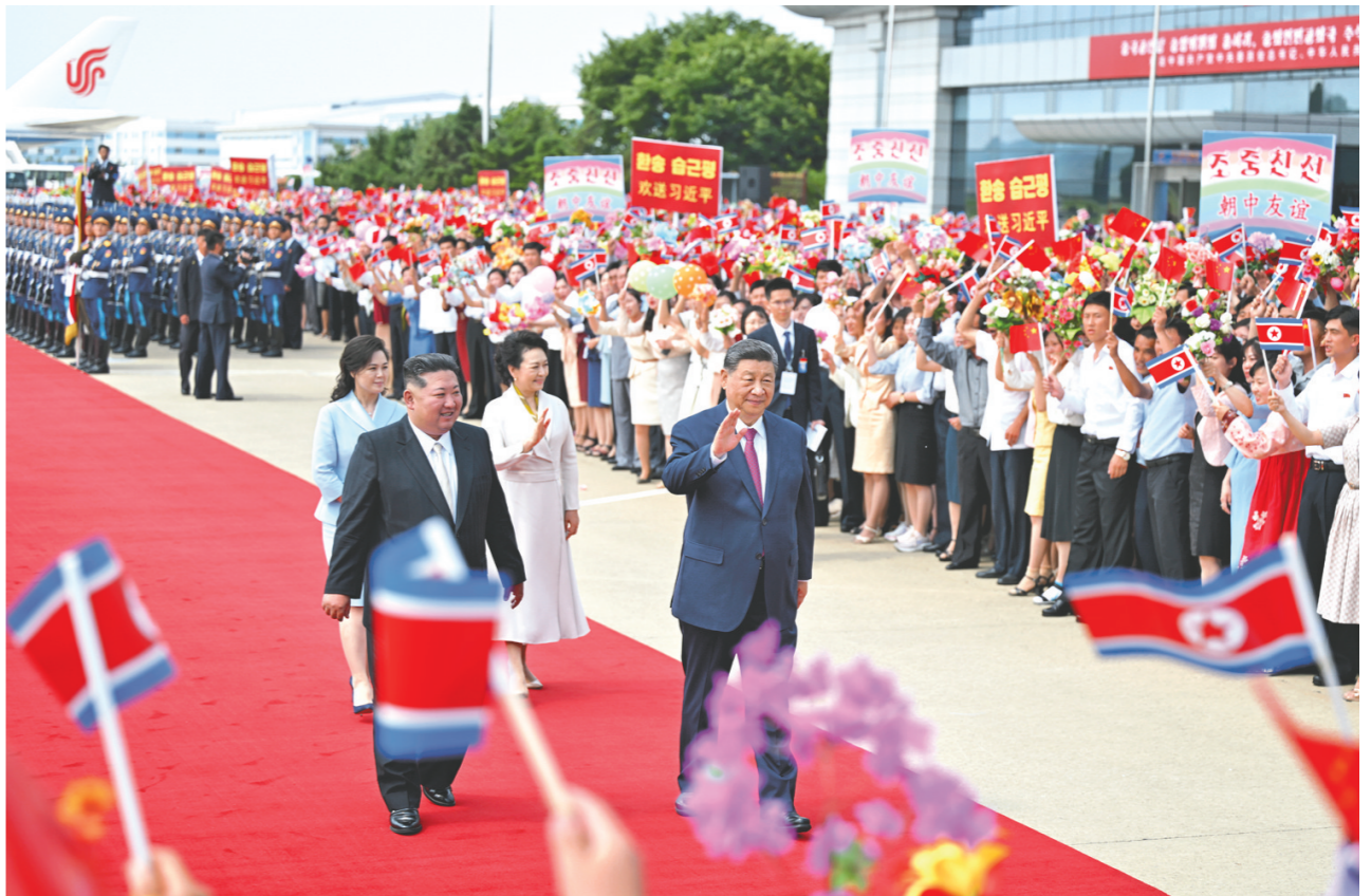
当地时间6月9日下午,中共中央总书记、国家主席习近平结束对朝鲜的国事访问离开平壤。朝鲜劳动党总书记、国务委员长金正恩和夫人李雪主到机场送行,为习近平和夫人彭丽媛举行隆重的欢送仪式。