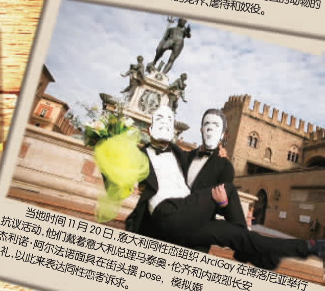
当地时间11月20日,意大利同性恋组织 ArciGay 在博洛尼亚举行抗议活动,他们戴着意大利总理马泰奥·伦齐和内政部长安杰利诺·阿尔法诺面具在街头摆 pose,模拟婚礼,以此来表达同性恋者诉求。