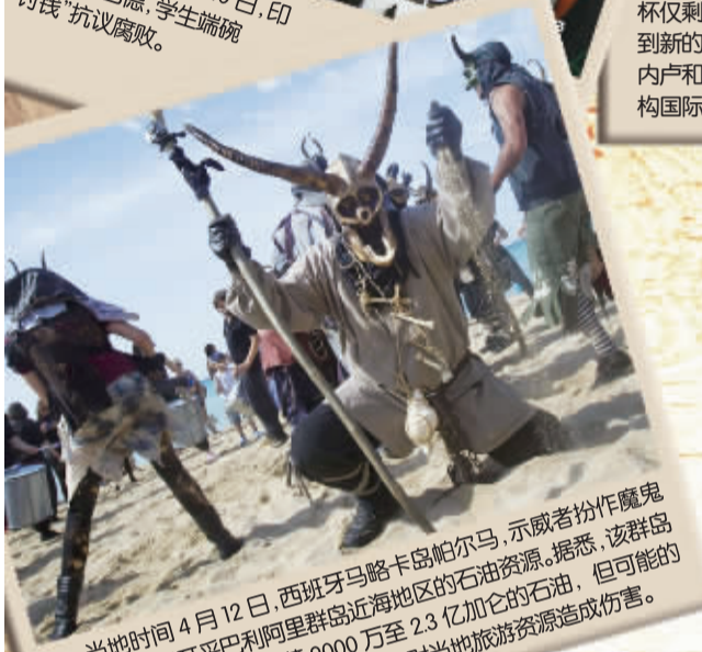
当地时间4月12日,西班牙马略卡岛帕尔马,示威者扮作魔鬼在海滩上抗议开采巴利阿里群岛近海地区的石油资源。据悉,该群岛附近海域蕴藏9000万至2.3亿加仑的石油,但可能的开采活动将对当地旅游资源造成伤害。