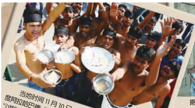
当地时间11月10日,印度阿拉哈巴德,学生端碗“讨钱”抗议腐败。