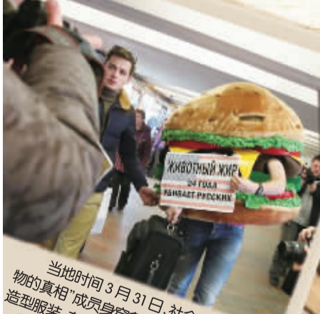
当地时间3月31日,社会活动组织“食物的真相”成员身穿象征美国食品的汉堡包造型服装,在莫斯科第一家麦当劳餐厅前抗议,打出“将美式快餐驱逐出境”的口号,回应美国对俄罗斯的制裁。