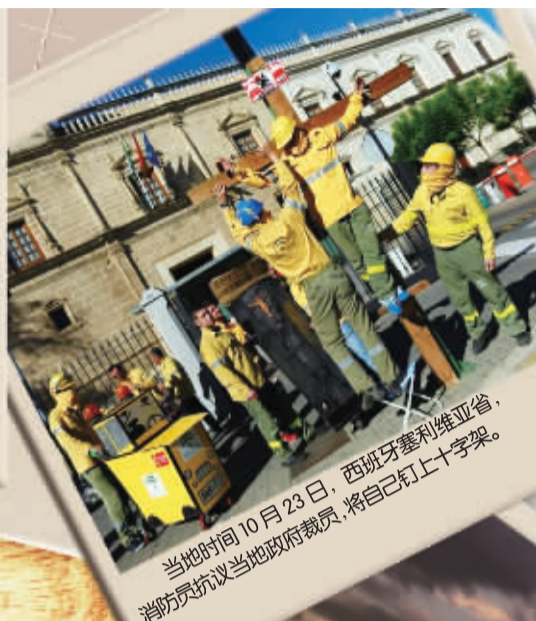
当地时间10月23日,西班牙塞利维亚省,消防队员抗议当地政府裁员,将自己钉上十字架。