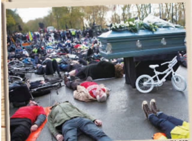
当地时间11月15日,来自伦敦各地的自行车骑行者举行形式特别的抗议活动,他们为自己举行象征性的葬礼,并扮演死者,以此来为因缺乏骑车安全而在交通事故中死去的人们发声抗议,呼吁为骑行者创造安全的骑车环境。