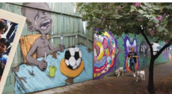
据俄罗斯RT新闻网5月29日报道,距离巴西2014年世界杯仅剩两周时间,许多认为世界杯已成为巴西经济负担的人寻找新的方式进行抗议,即在墙上涂鸦。这些街头艺术家在里约热内卢和圣保罗等城市建筑的墙上绘制各种图形,谴责足球管理机构国际足联剥削巴西,以及当地政府忽略穷人诉求等。