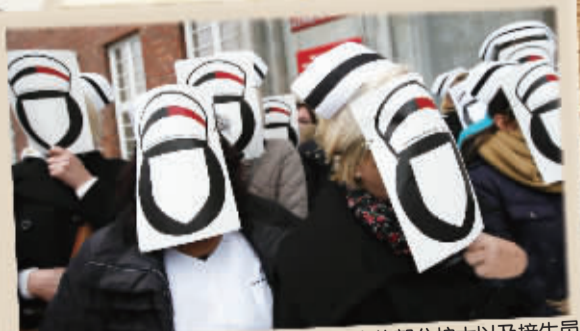
当地时间11月6日,波兰格丹斯克的部分护士以及接生员头戴无脸面具在波美拉尼亚警长办公室前游行抗议,要求增加薪水以及更好的工作环境。