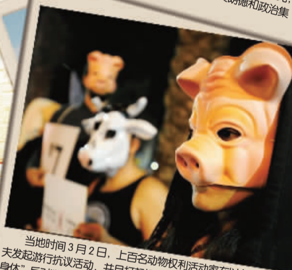
当地时间3月2日,上百名动物权利活动家在以色列特拉维夫发起游行抗议活动,并且打起标语:“肉是不愿意死去的动物的身体”,反对猎杀动物以及对动物的笼养、虐待和奴役。