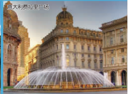
意大利费拉里广场