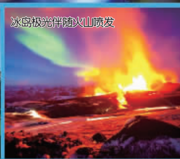
冰岛极光伴随火山喷发