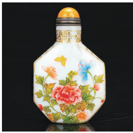
琉璃画珐琅蝶恋花鼻烟壶

“春晴喜鹊噪前津,鹊噪前津柳媚新。津柳媚新花恋蝶,新花恋蝶去来频。”每一只蝴蝶生前都是一朵花的鬼魂,一只蝶,一朵花,谱出无数动人的故事,将春日的温暖洒满人间。(据《西安晚报》)