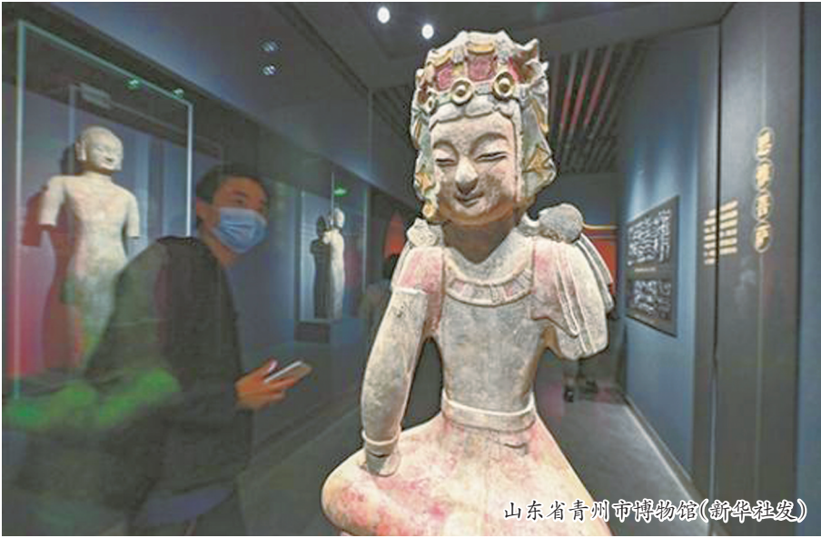
山东省青州市博物馆

以旅行的方式探秘各地著名的博物馆,不远千里来一次博物馆主题游,早已不是什么新鲜事。但在当前文旅深度融合的时代背景下,博物馆游的热度却是远胜以往,成为跨越各个年龄段的时尚出游主题。从今年五一假期的出游情况就能看出——全